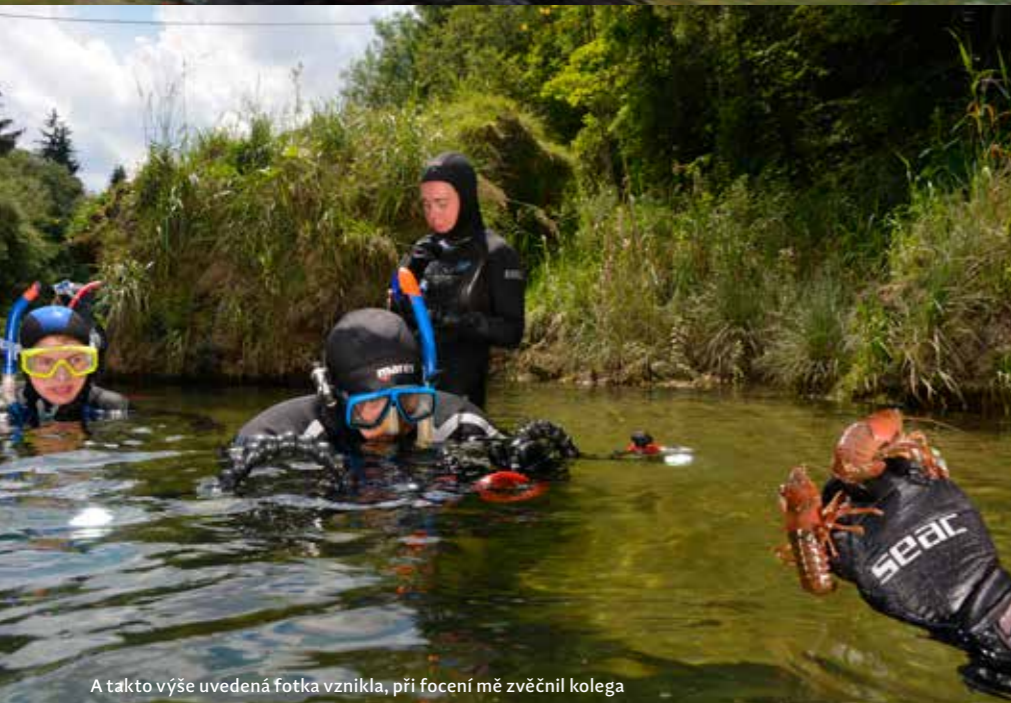
A takto výše uvedená fotka vznikla, při focení mě zvěčnil kolega