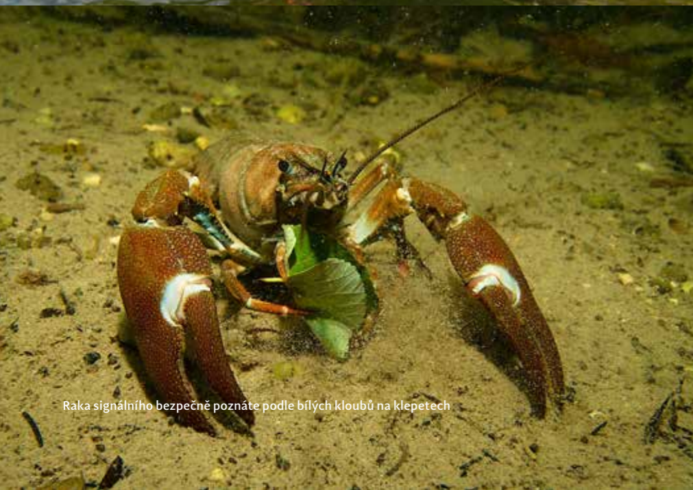
Raka signálního bezpečně poznáte podle bílých kloubů na klepetech

doprava a dálnici podjedete, po dvou kilometrech dojedete na křižovatku, kde se dáte doleva přes most (po pravé straně máte rybí restauraci), dále už je cesta na základnu značená; z Českých Budějovic je to sem 155 kilometrů