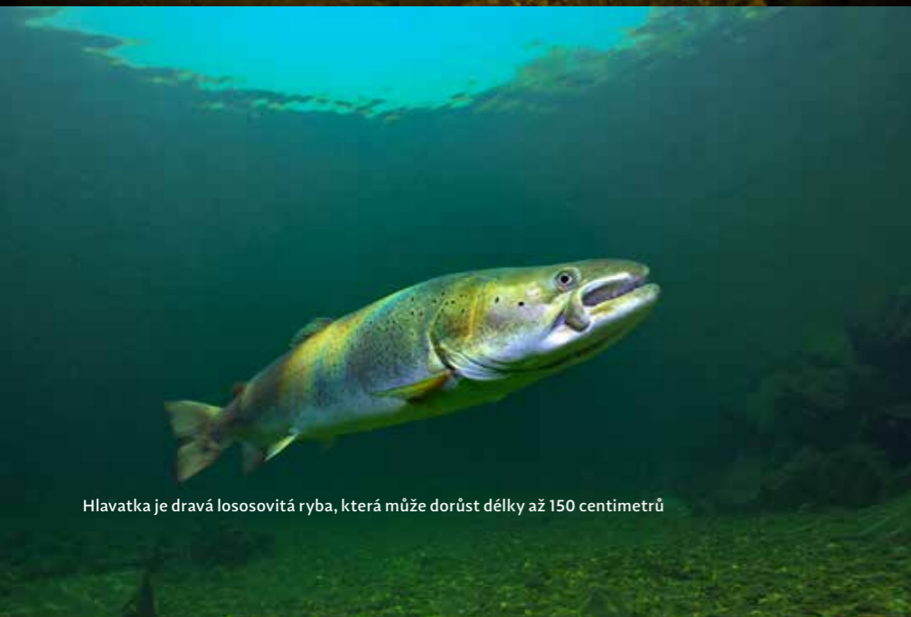
Hlavatka je dravá lososovitá ryba, která může dorůst délky až 150 centimetrů