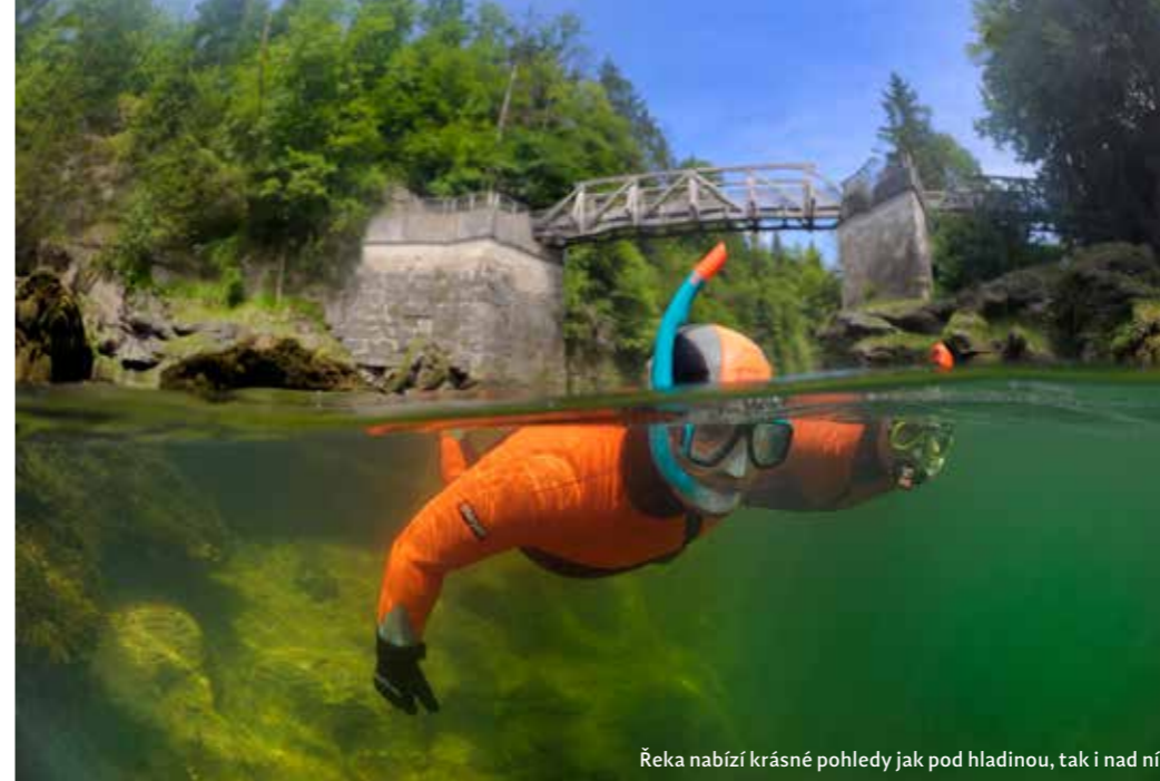
Řeka nabízí krásné pohledy jak pod hladinou, tak i nad ní