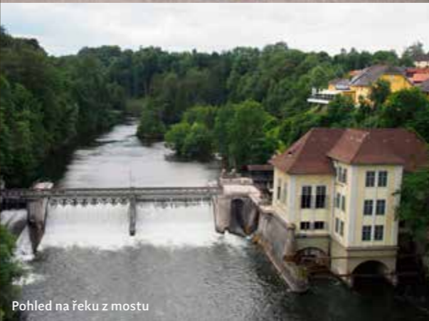
Pohled na řeku z mostu