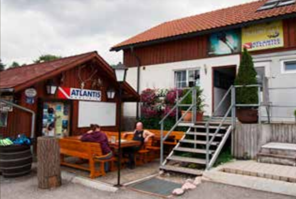
Budova základny ATLANTIS je velmi dobře vybavená