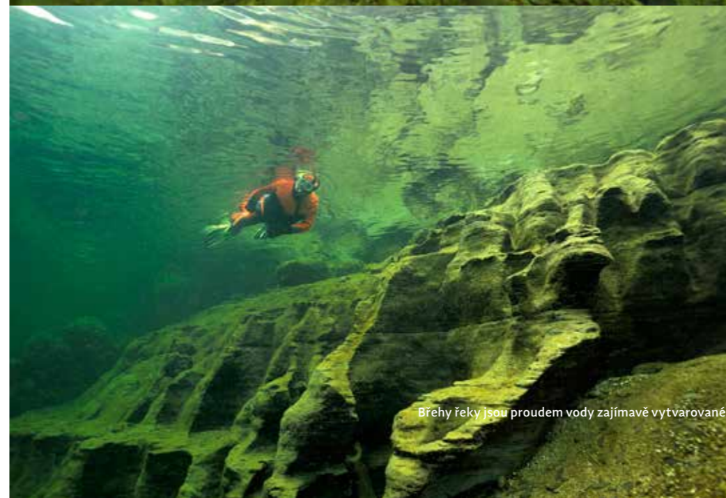
Břehy řeky jsou proudem vody zajímavě vytvarované