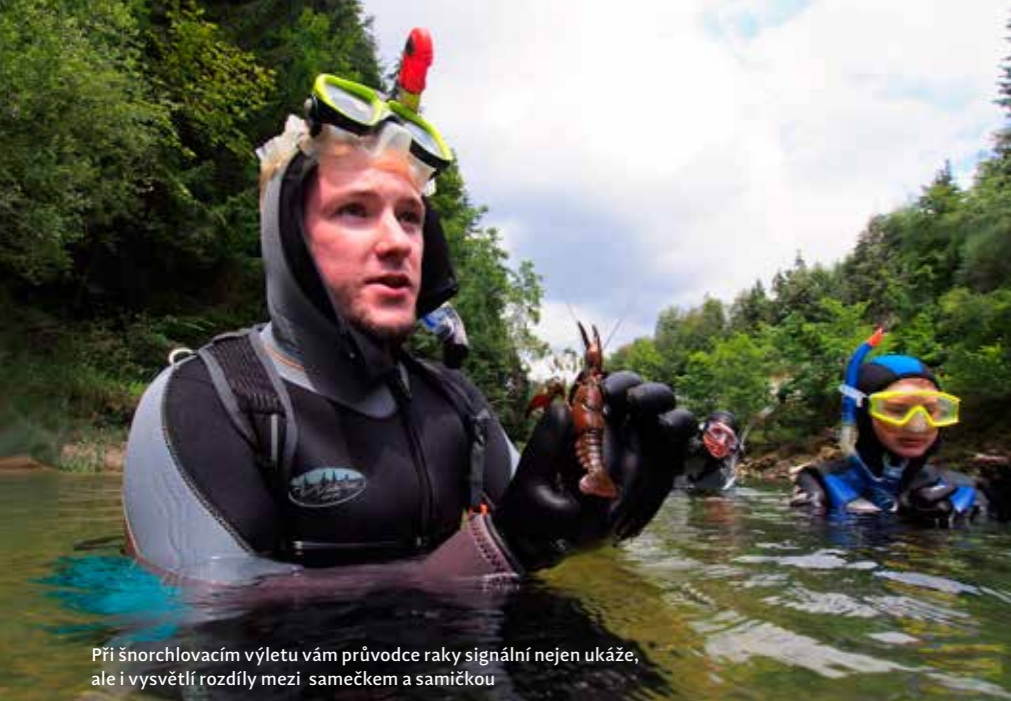
Při šnorchlovacím výletu vám průvodce raky signální nejen ukáže, ale i vysvětlí rozdíly mezi samečkem a samičkou