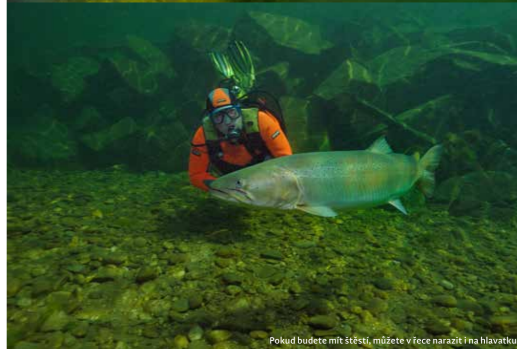
Pokud budete mít štěstí, můžete v řece narazit i na hlavatku