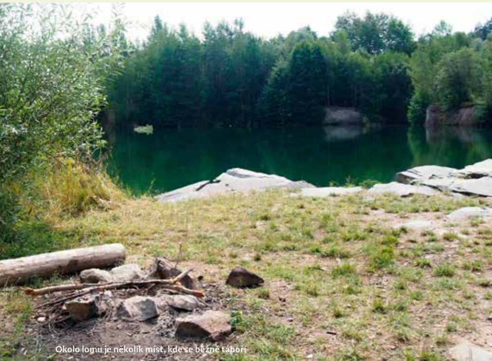
Okolo lomu je několik míst, kde se běžně táborí

Klasickou Leštinku, která je určitě nejlepší potápěčskou základnou v Česku, zná snad každý český potápěč. Méně lidí už však ví, že v těsné blízkosti jsou další dva zatopené lomy, které jsou pro potápění také vhodné. My se dnes podíváme na lom Zvěřinov, jenž má název podle původního majitele lomu Antonína Zvěřiny. Začátky těžby v této oblasti se datují od roku 1870 a zdejší žula se používala hlavně na výrobu dlažebních kostek, k velkému rozmachu těžby dochází od roku 1893, kdy zdejší dlažební kostky začala odebírat Vídeň jako takzvanou „vídeňskou dlažbu“. V roce 1903 pak začíná stálý provoz i na lomu Zvěřinov, kde se nejdříve těžil stěnovým způsobem a později jámovým. V tomto lomu se dokonce těžily hned tři druhy žuly: růžová, černá a světlá. Těžba zde byla ukončena v roce 1970 a poté se lom začal pomalu zatápět vlivem přítoků spodních vod, jelikož dno lomu bylo pod úrovní potoka Žejbro.