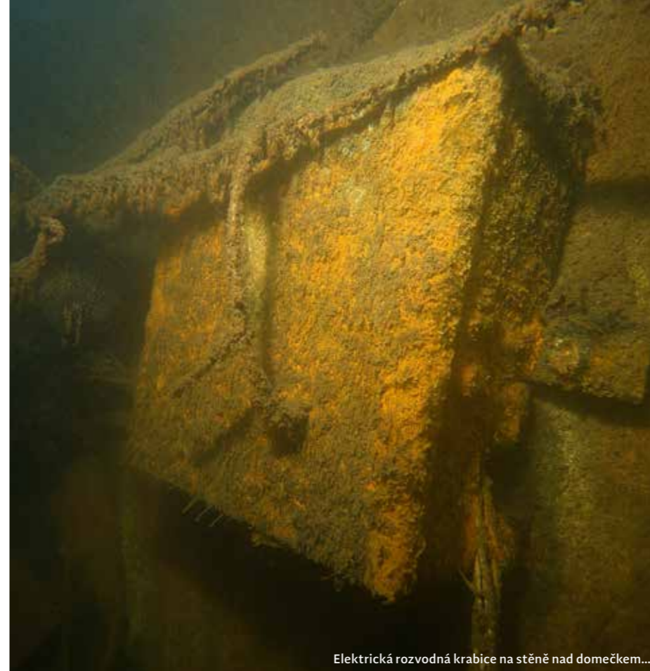
Elektrická rozvodná krabice na stěně nad domečkem...