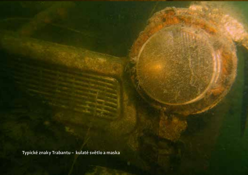
Typické znaky Trabantu – kulaté světlo a maska