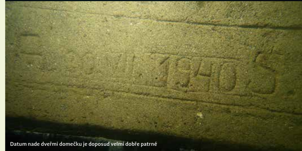
Datum nade dveřmi domečku je doposud velmi dobře patrné