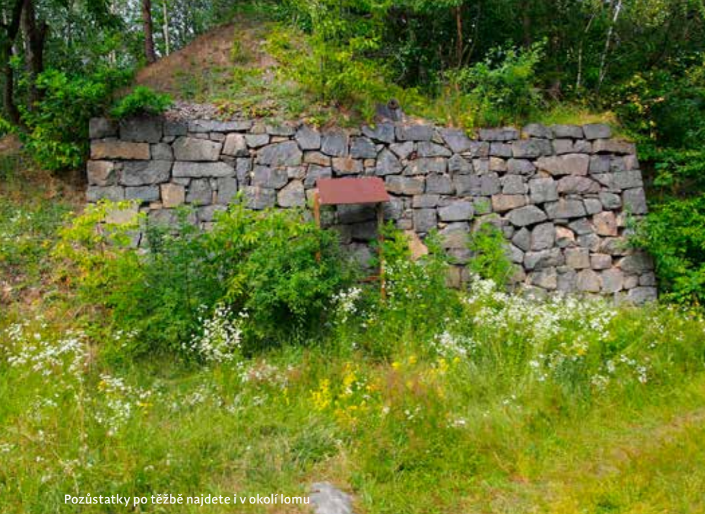
Pozůstatky po těžbě najdete i v okolí lomu

přilepený k jižní stěně lomu v hloubce 13 metrů prakticky přímo pod vstupem do vody v jihozápadním rohu. Nade dveřmi je dodnes patrné datum 30. VII. 1940, pravděpodobně se jedná o datum, kdy byl domeček dostavěn. Pokud po trubkách, které z domečku vedou, klesnete ke dnu, to je zde přibližně v 18 metrech, najdete tu velkou železnou konstrukci, dost možná konstrukci nějakého dopravníkového pásu a také velkou pneumatiku. Pokud budete od domečku stoupat nahoru podél kabelů přidělaných ke stěně lomu, najdete zde několik rozvodných skříní a také bílý amplión. U bývalé příjezdové cesty do lomu můžete v hloubce tří metrů najít starý kryt střelmistra, ten zde leží na boku již bez dveří. O kus dál podél stěny lomu narazíte v hloubce čtyř metrů na vrak automobilu Trabant, jedná se o model 601 ve verzi sedan a je stále kompletní, včetně rezervního kola v kufru a autobaterie u motoru. Jak se sem ale Trabant dostal, to se mi zjistit nepodařilo. Při obeplavání lomu jsme narazili ještě na několik drobnějších pozůstatků po těžbě, ale je možné, že na dně budou i další větší věci.