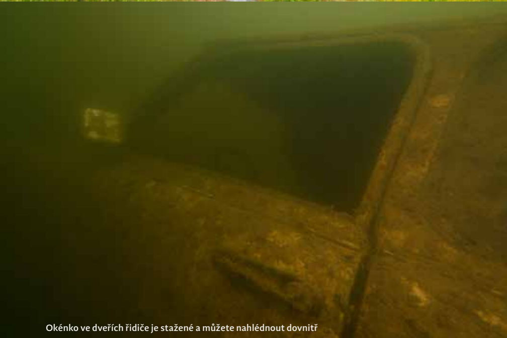
Okénko ve dveřích řidiče je stažené a můžete nahlédnout dovnitř

NEJBLIŽŠÍ BAROKOMORA: Pardubická nemocnice, Centrum hyperbarické medicíny, Kyjevská 44, Pardubice ■