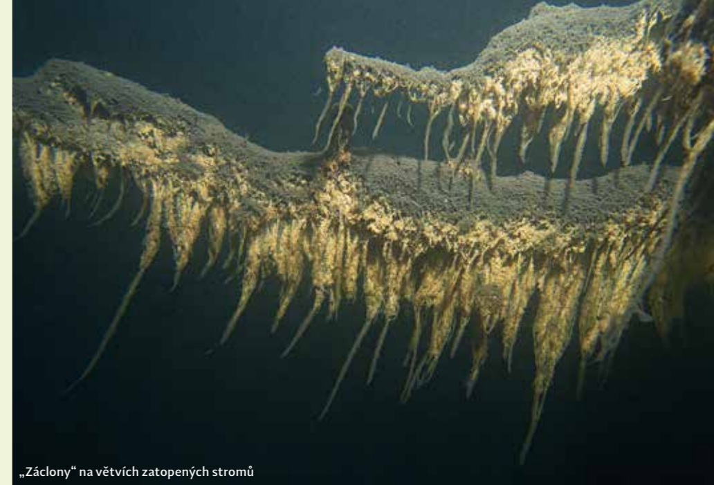
„Záclony“ na větvích zatopených stromů

Lom má přibližně obdélníkový tvar, delší strana má zhruba 200 metrů a kratší přibližně 50 metrů. Jelikož je lom do této výše zatopen poměrně krátkou dobu, je pod vodou všude spousta stromů, které brání volnému pohybu pod vodou a potápěči se musí stále něčemu vyhýbat. Asi nejzajímavější atrakcí v tomto lomu je zatopený domeček s čerpadly a elektrorozvodnou, ten najdete