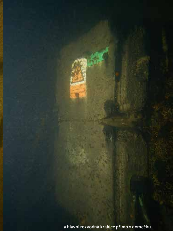
...a hlavní rozvodná krabice přímo v domečku