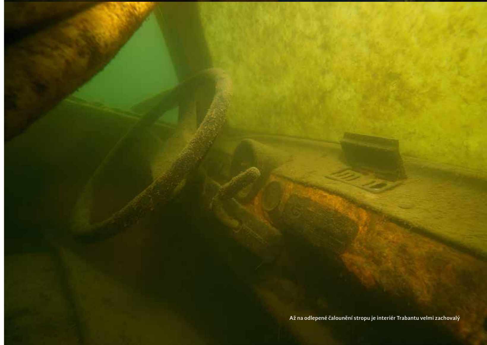
Až na odlepené čalounění stropu je interiér Trabantu velmi zachovalý