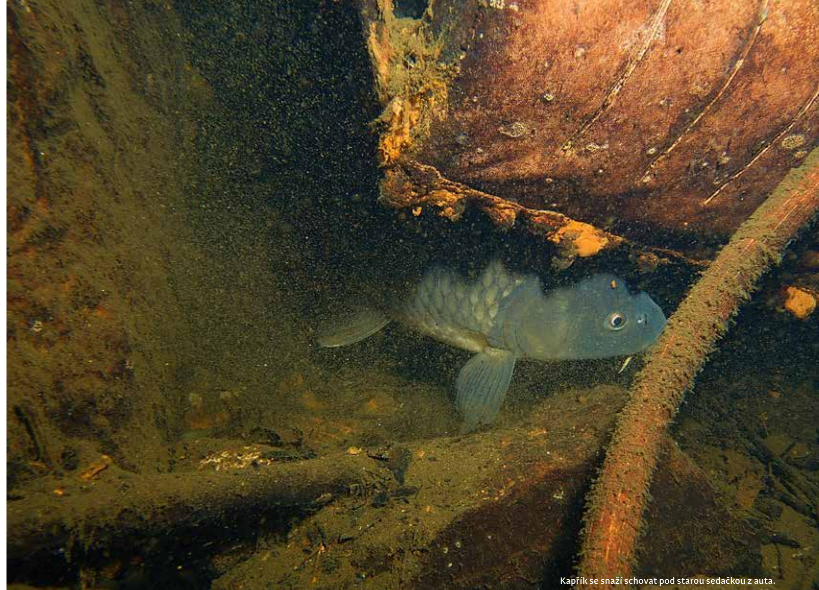
Kapřík se snaží schovat pod starou sedačkou z auta.

NEJBLIŽŠÍ BAROKOMORA: Všeobecná fakultní nemocnice, IV. Interní klinika, U nemocnice 2, Praha 2