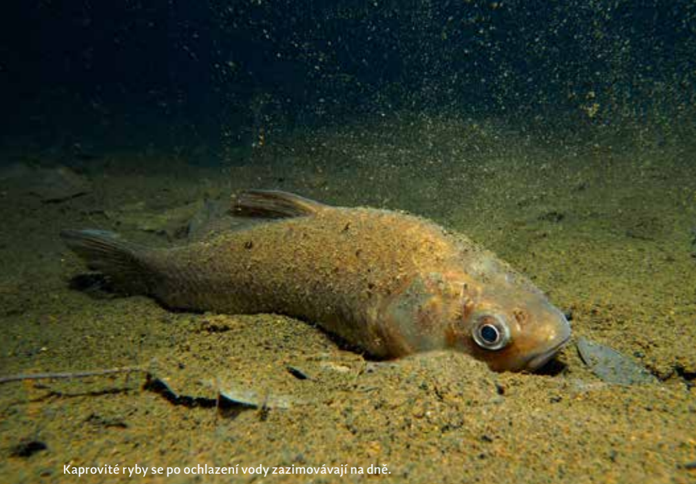
Kaprovité ryby se po ochlazení vody zazimovávají na dně.