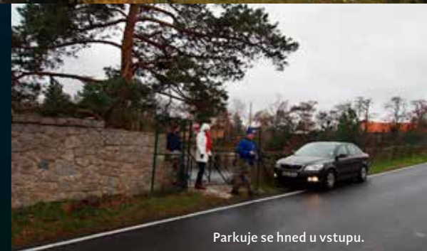
Parkuje se hned u vstupu.