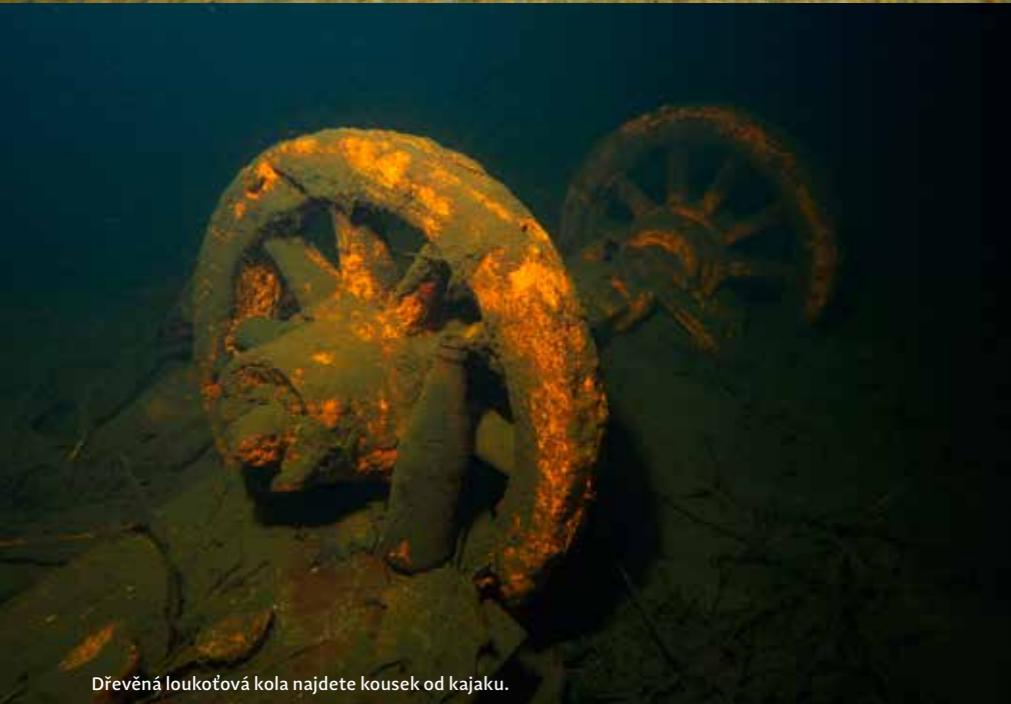
Dřevěná loukoťová kola najdete kousek od kajaku.