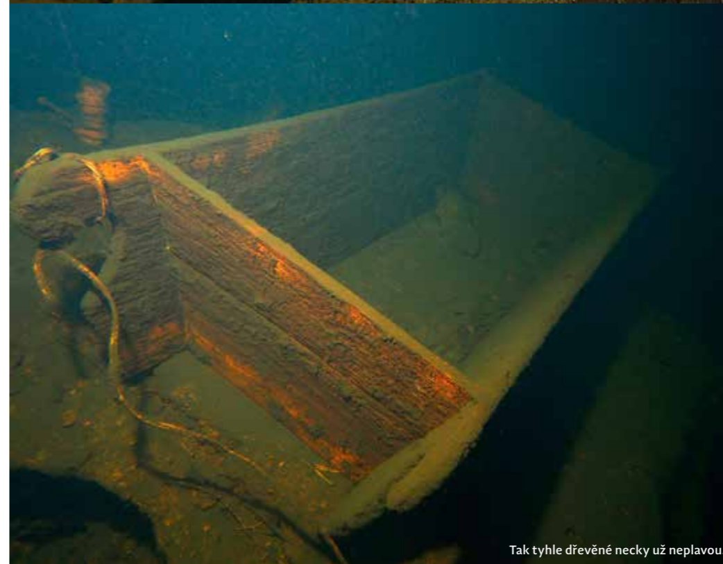
Tak tyhle dřevěné necky už neplavou.