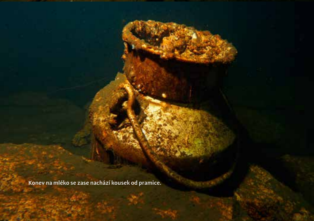
Konev na mléko se zase nachází kousek od pramice.