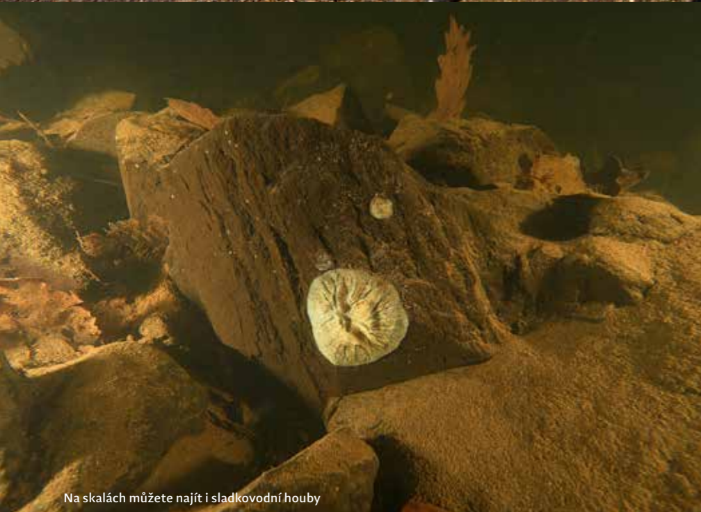
Na skalách můžete najít i sladkovodní houby