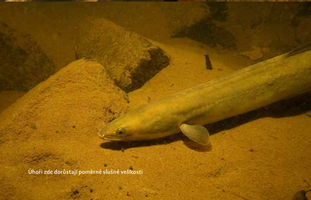
Úhoři zde dorůstají poměrně slušné velikosti

Zajímavé jsou pro potápění i skalní stěny na protějším břehu, sem si můžete naplavat buď po hladině, nebo to vzít spodem, dno se zde nachází v hloubce okolo 15 metrů a břehy jsou od sebe vzdáleny necelých 150 metrů.