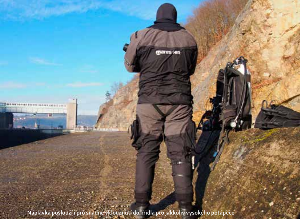
Náplavka poslouží i pro snadné vylouzení do křídla pro jakkoliv vysokého potápěče