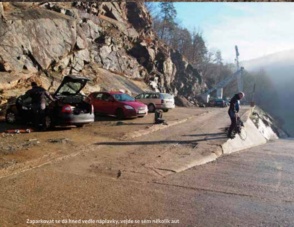
Zaparkovat se dá hned vedle náplavky, vejde se sem několik aut

Štěchovická přehrada je osmou v pořadí ve vltavské kaskádě, postavená však byla již jako druhá, tedy dříve než potápěčsky známější Slapy nebo Orlík. Stavba přehrad byla zahájena v roce 1937, a i díky prodlevám ve stavbě způsobeným 2. světovou válkou, byla dostavěna až v roce 1945. Hlavním účelem přehrad je regulace toku Vltavy v energetické špičce, tedy když Slapy a Orlík díky běžícím vodním elektrárnám vypouštějí větší množství vody. I v hrázi této přehrad je umístěna vodní elektrárna, ta byla uvedena do provozu již v roce 1943, tedy ještě před celkovým dokončením vodního díla, hlavním důvodem urychlení výstavby elektrárny byl nedostatek elektrické energie v zemi.