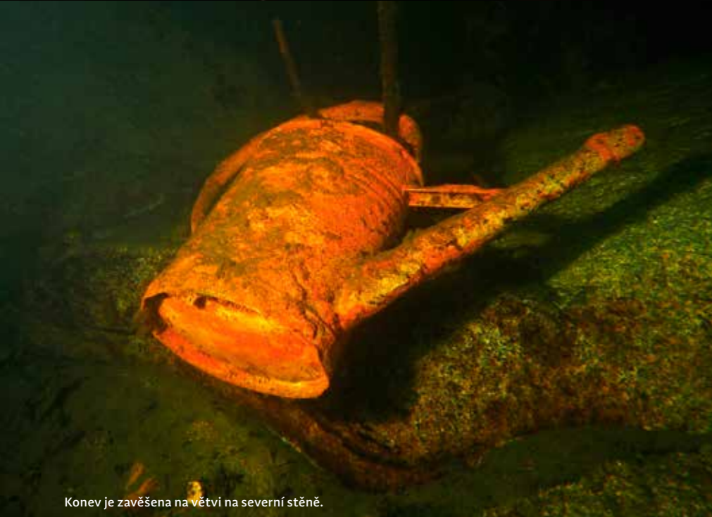
Konev je zavěšena na větvi na severní stěně.