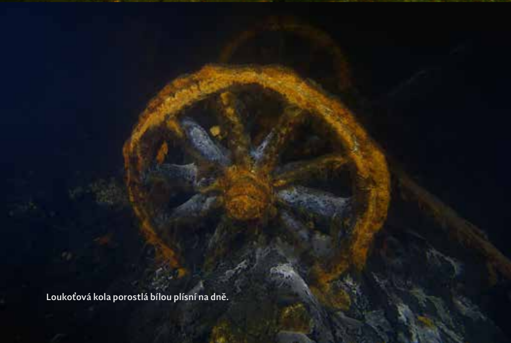
Loukořová kola porostlá bílou plísní na dně.