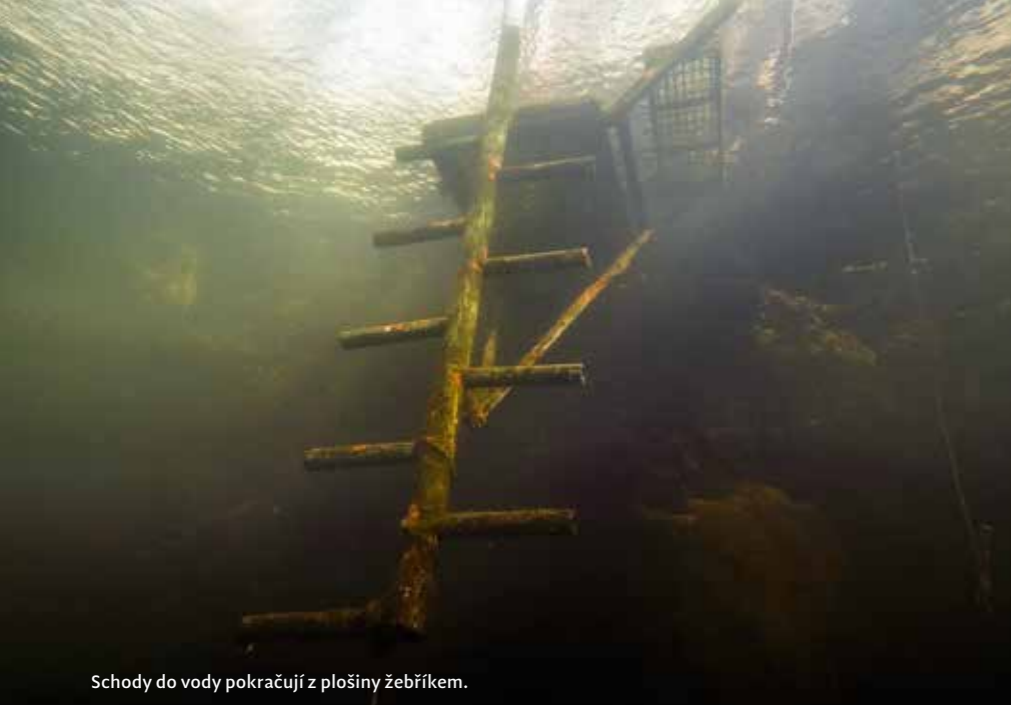
Schody do vody pokračují z plošiny žebříkem.