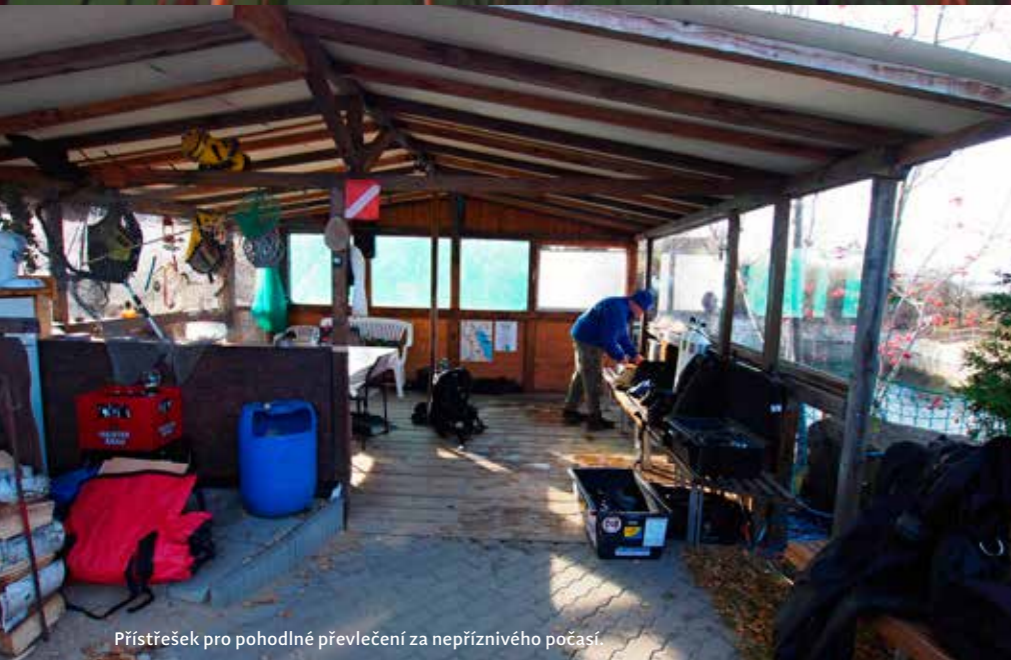
Přístřešek pro pohodlné převlečení za nepříznivého počasí.

ATRAKCE POD VODOU: karavan, část karoserie Trabanta, motokára, traktůrková sekačka, žebříňák, loukoťová kola, jízdní kola, sloup elektrického vedení, pneumatiky, elektrická pec, výcviková plata v různých hloubkách, spousta drobných artefaktů