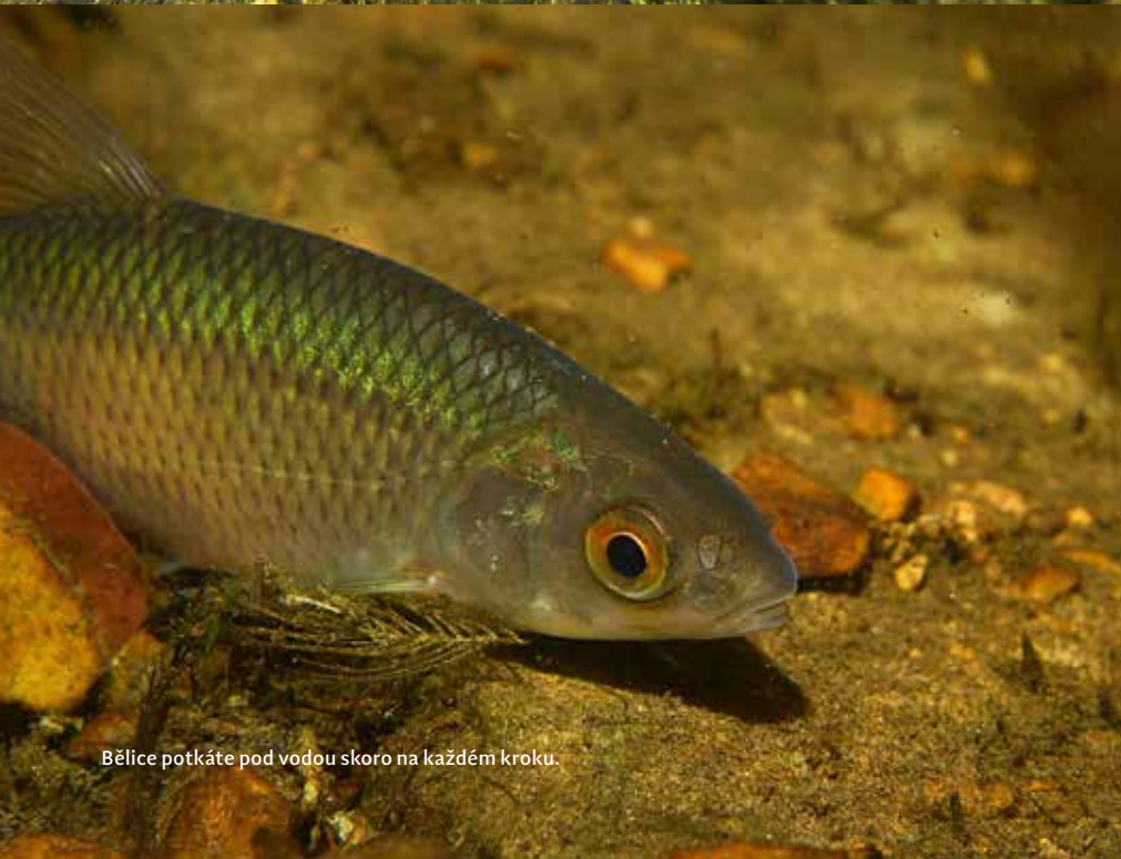
Bělice potkáte pod vodou skoro na každém kroku.