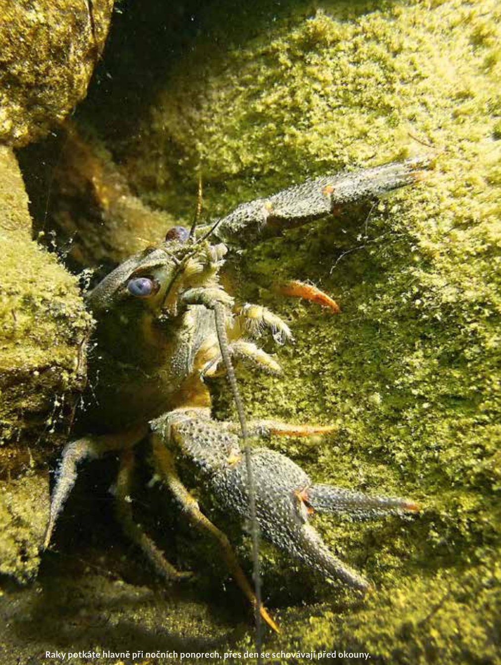
Raky potkáte hlavně při nočních ponorech, přes den se schovávají před okouny.

po těžbě; většina atrakcí je vyvázána linkami pro jejich snadnější nalezení.