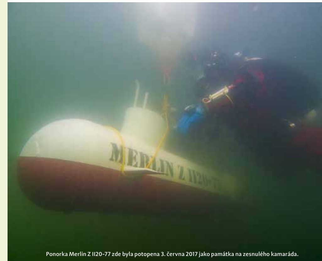
Ponorka Merlin Z II20-77 zde byla potopena 3. června 2017 jako památka na zesnulého kamaráda.

PŘÍJEZD NA LOKALITU: Pokud pojedete ze směru od Prahy, tak na konci D10 sjedte na Železný Brod, v Brodě na náměstí odbočte doprava směrem na Semily, ale hned (ještě před mostem) se dejte doleva směrem na Bozkov. Projedte celým Bozkovem a další obcí je Jesenný, jeďte po hlavní silnici asi jeden kilometr, lom se nachází přímo uprostřed obce, orientačním bodem je vysoká cihlová