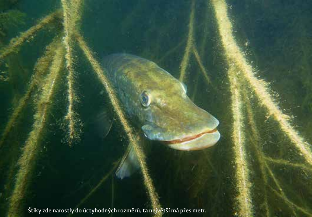
Štíky zde narostly do úctyhodných rozměrů, ta největší má přes metr.