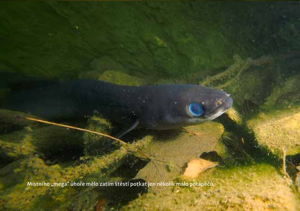
Místního „mega“ úhoře mělo zatím štěstí potkat jen několik málo potápěčů.

věž (bývalý mlýn na vápenec), kterou uvidíte po pravé straně od hlavní silnice, pár metrů za odbočkou na Zlatou Olešnici. Zde je vjezd do areálu lomu, kde můžete bez problému zaparkovat.