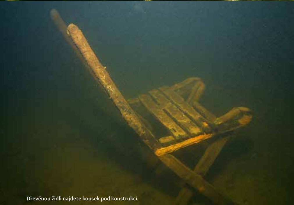
Dřevěnou židli najdete kousek pod konstrukcí.