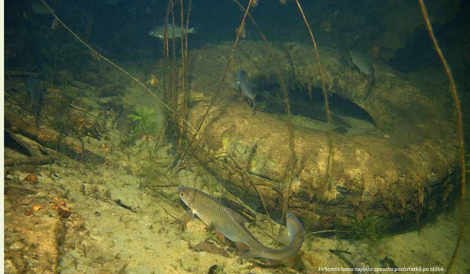
I v tomto lomu najdete spoustu pozůstatků po těžbě.

NEJBLIŽŠÍ BAROKOMORA: Gerontocentrum – Rehabilitační ústav, Husitská 352, Hostinné ■