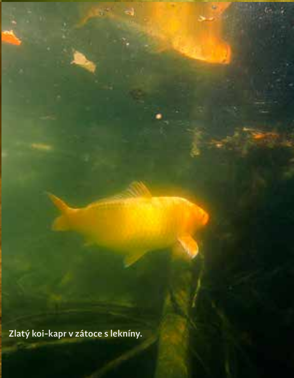
Zlatý koi-kapr v zátoce s lekníny.