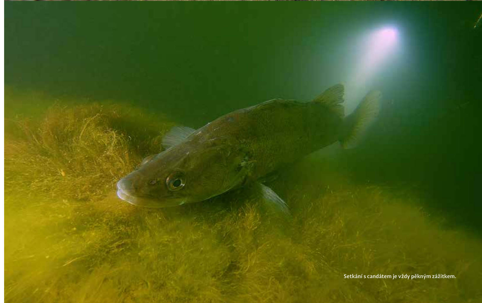
Setkání s candátem je vždy pěkným zážitkem.