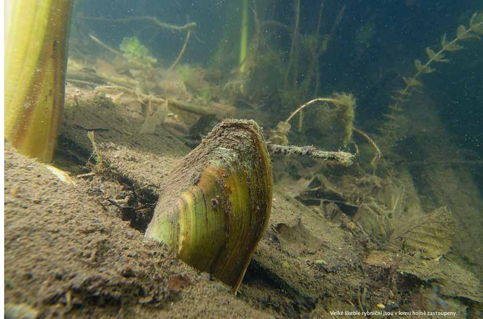
Velké škeble rybníční jsou v lomu hojně zastoupeny.

ATRAKCE POD VODOU: dvě výcviková plata, mělčí 4 m., hlubší 12 m., železná konstrukce, vrak VW Transporter, keson, ponorka Merlin, cívka, sloup, jeskyně, drobné pozůstatky