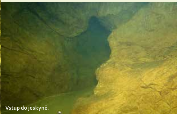
Vstup do jeskyně.