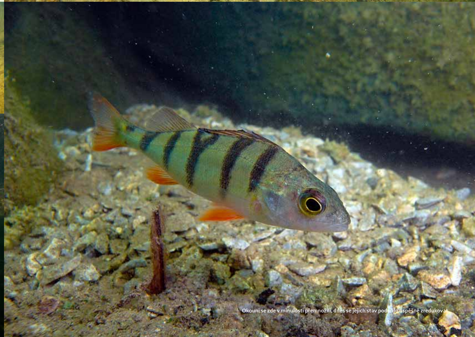
Okouni se zde v minulosti přemnožili, dnes se jejich stav podařilo úspěšně zredukovat.