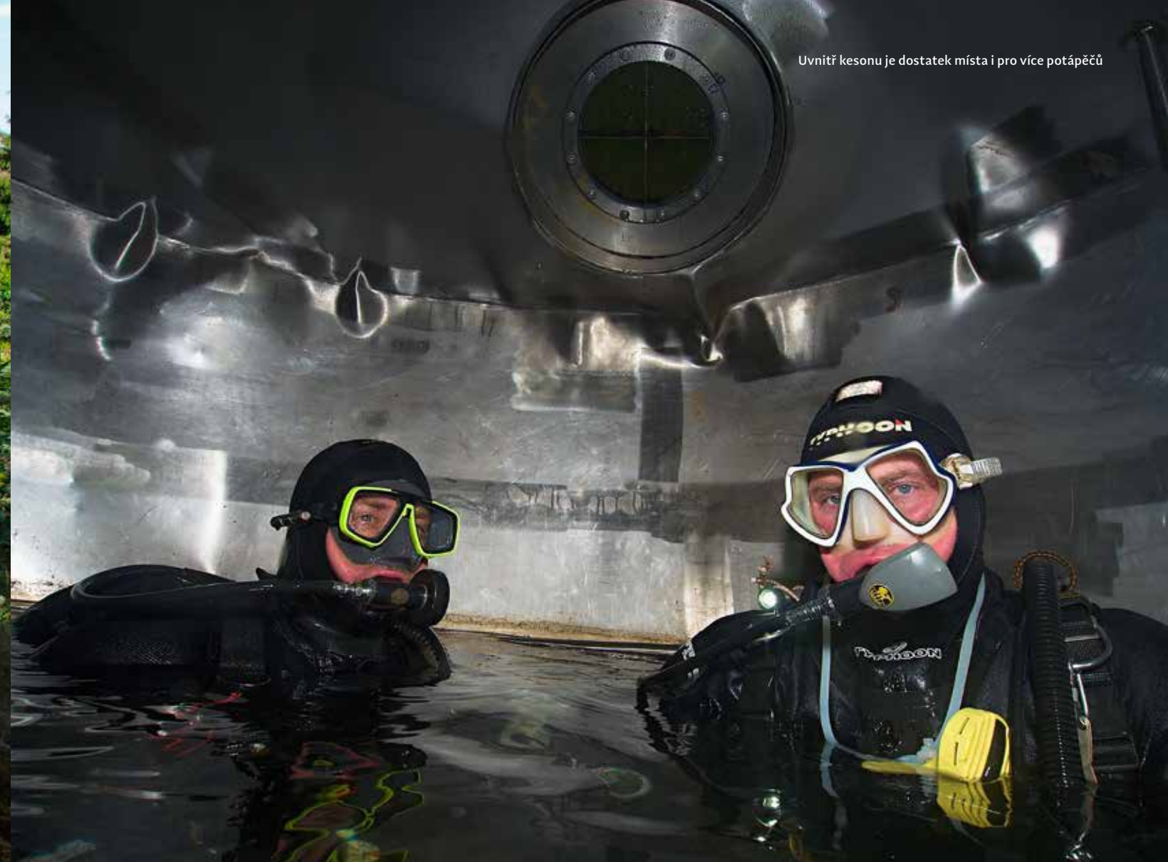
Uvnitř kesonu je dostatek místa i pro více potápěčů

KRAJ: Pardubický kraj NEJBLIŽŠÍ MĚSTO: Holetín, Hlinsko GPS: 49°48'55.77"S 15°55'29.22"V TYP: lom MAXIMÁLNÍ HLOUBKA: 23 m PRŮMĚRNÁ VIDITELNOST DLE SP: 4 m NEJLEPŠÍ OBDOBÍ NA NÁVŠTĚVU: celoročně PROVOZOVATEL: Klub sportovních potápěčů C-21 Hradec Králové PROVOZNÍ DOBA ZÁKLADNY: návštěva je možná pouze po předchozí telefonické domluvě KONTAKT: www.potapecihk.cz , Ing. Vladimír Drábek, tel. 602 618 858, vrabek@atlas.cz CENÍK: členové Svazu českých potápěčů zdarma (prokáží se logbookem se známkou SČP) VSTUP: Vstup do vody je možný pouze z jednoho místa, z uměle vytvořené plošiny několik desítek centimetrů nad hladinou lomu, ze které vedou do vody pohodlné schody.