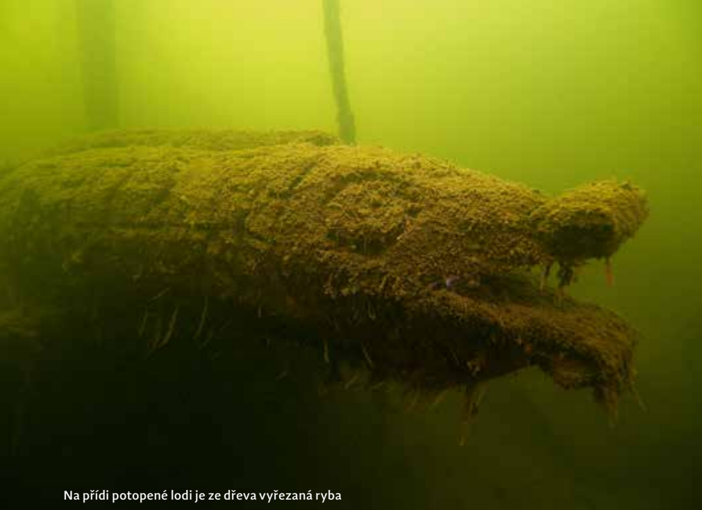
Na přídi potopené lodi je ze dřeva vyřezaná ryba