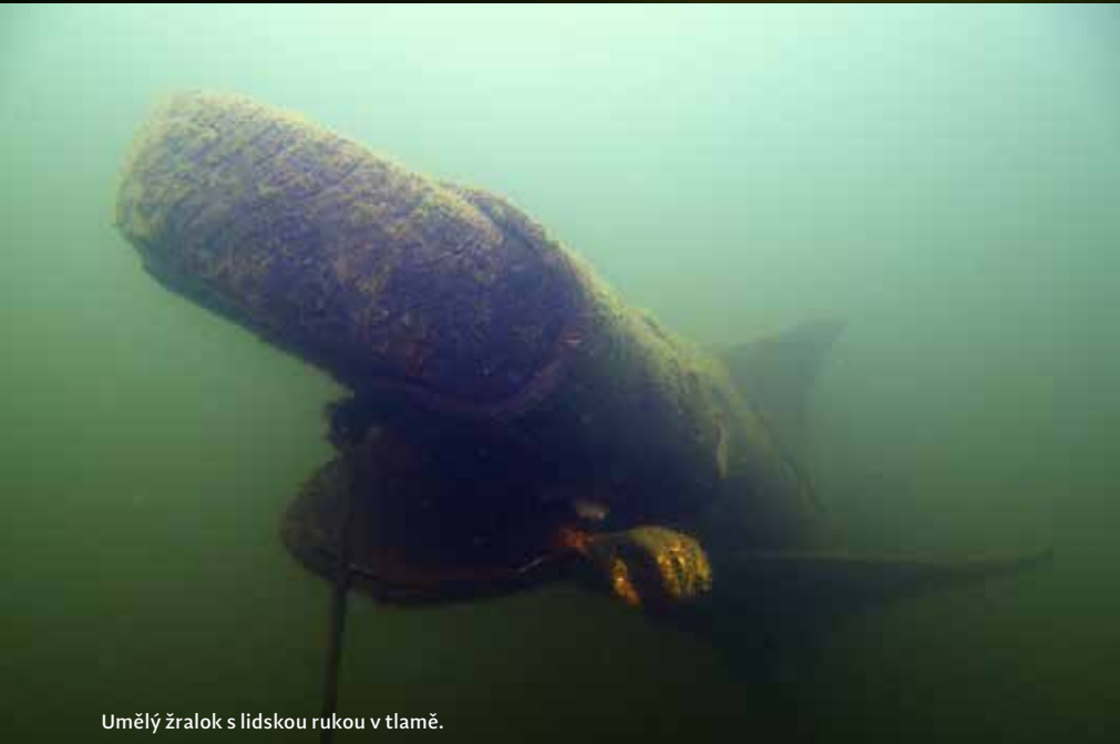
Umělý žralok s lidskou rukou v tlamě.