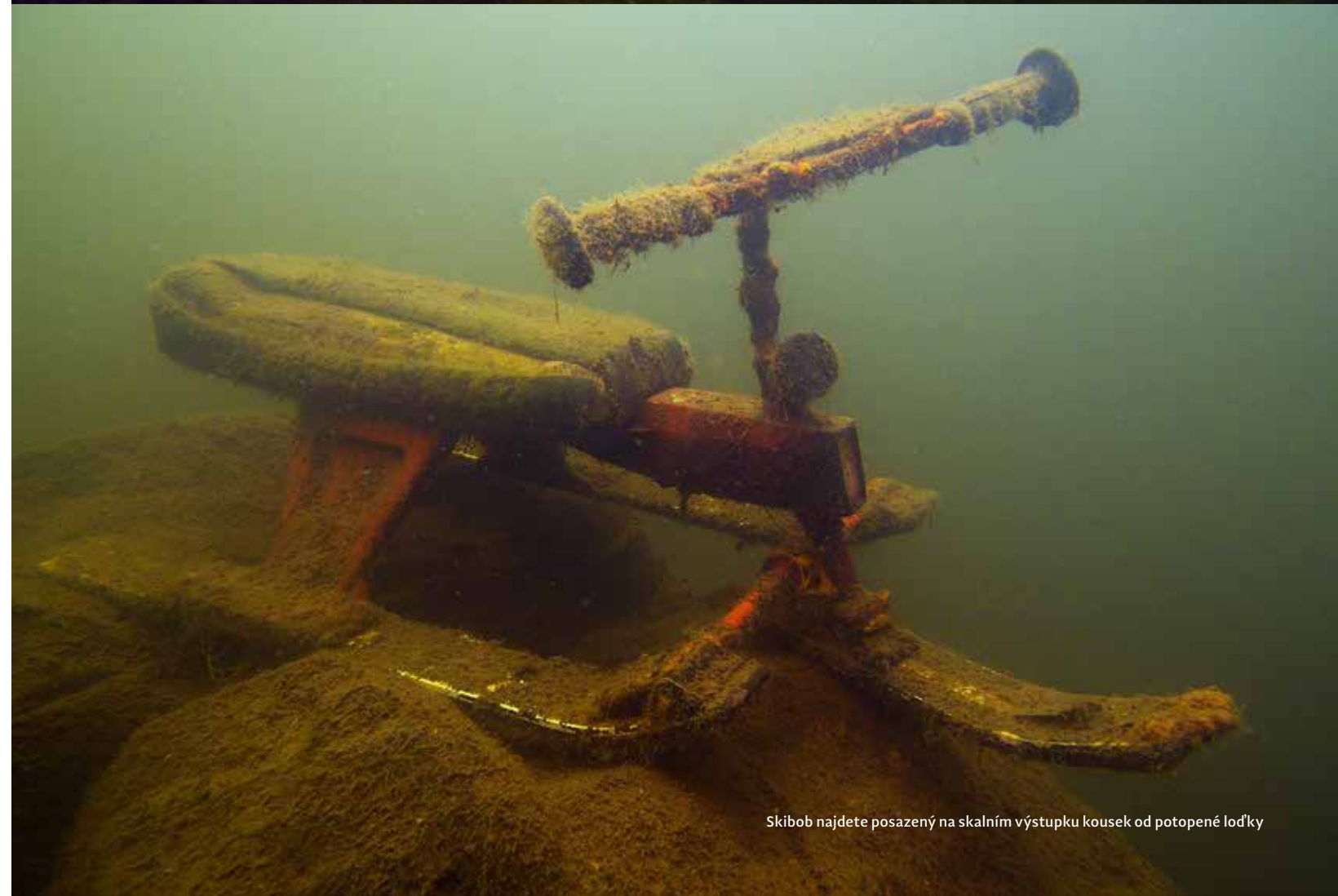
Skibob najdete posazený na skalním výstupku kousek od potopené lodky