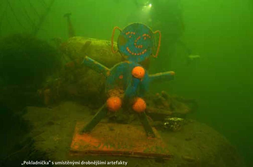
„Pokladnička“ s umístěnými drobnějšími artefakty