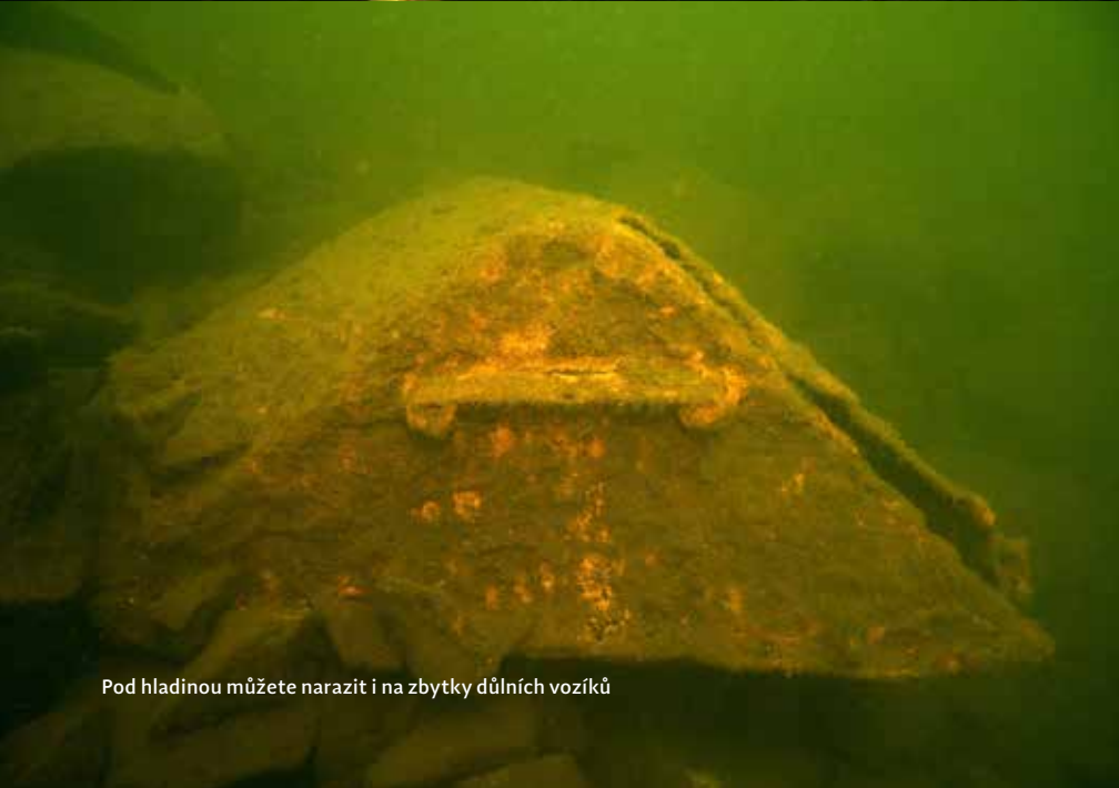
Pod hladinou můžete narazit i na zbytky důlních vozíků