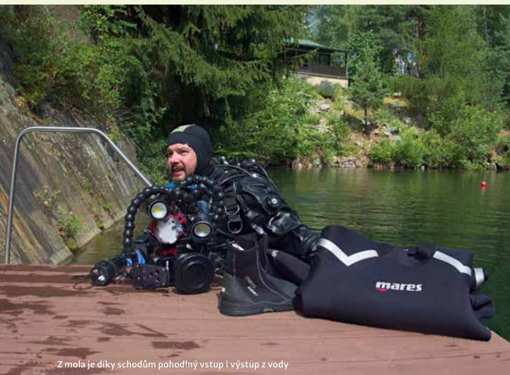
Z mola je díky schodům pohodlný vstup i výstup z vody

Moderní historie tohoto lomu se začala psát v roce 1936, kdy pan Holec z Kroměříže založil firmu na zpracování kamene, jelikož okolo Kroměříže nejsou prakticky žádné vhodné lokality k těžbě kamene, vyhlédl si právě tři lomy ve skoro dvě stě kilometrů vzdáleném Holetíně. V roce 1948 byl i tento lom spolu se všemi stavbami znárodněn a postupem času patřil pod několik národních podniků, které se věnovaly těžbě a zpracování kamene. K ukončení těžby došlo začátkem 60. let a lom se začal postupně zaplňovat vodou ze spodních pramenů. První průzkumné ponory se na tomto lomu uskutečnily v letech 1969–1970 a od roku 1971 se zde začalo s výstavbou potápěčského výcvikového centra pod hlavičkou Svazarmu. Po revoluci byly pozemky vráceny do rukou rodiny Holců a následně byla uzavřena smlouva o pronájmu s Klubem sportovních potápěčů Hradec Králové, který toto krásné potápěčské středisko spravuje dodnes.