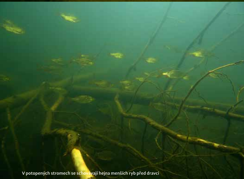
V potopených stromech se schovávají hejna menších ryb před dravci