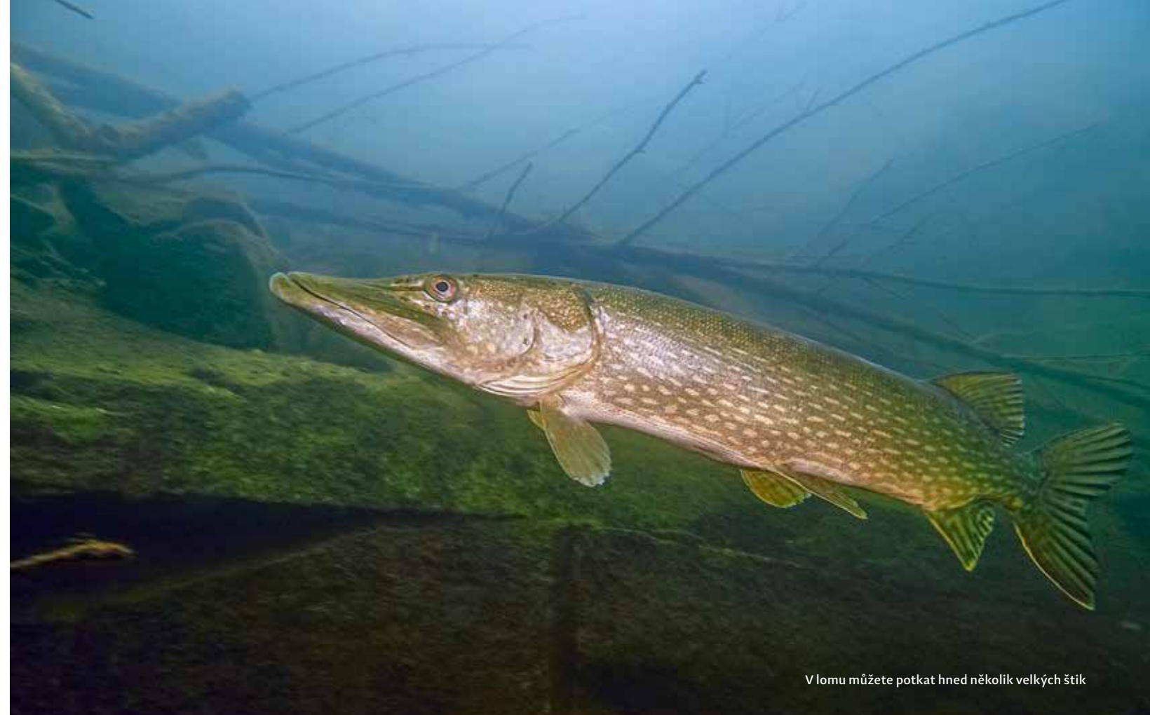
V lomu můžete potkat hned několik velkých štik