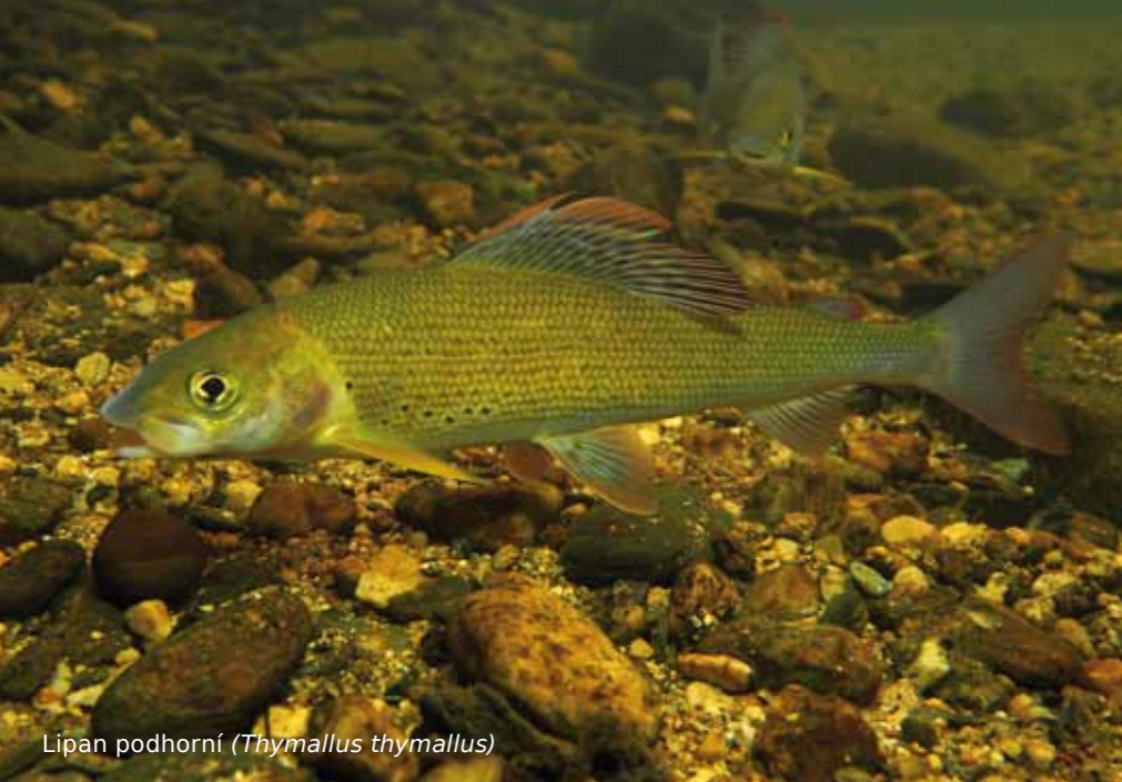
Lipán podhorní ( Thymallus thymallus )