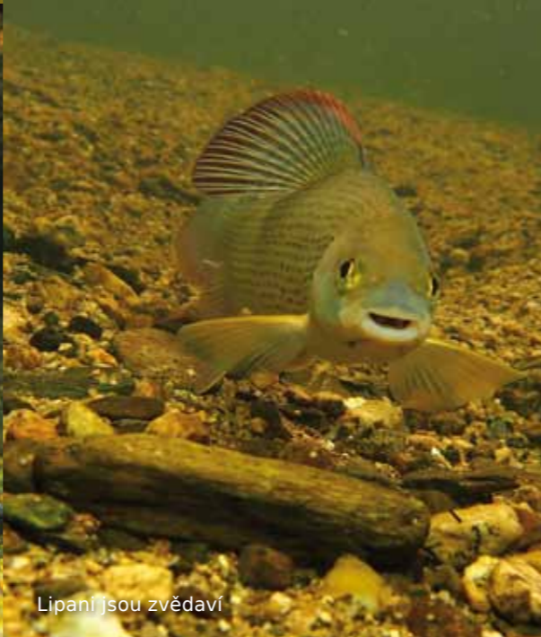
Lipani jsou zvědaví