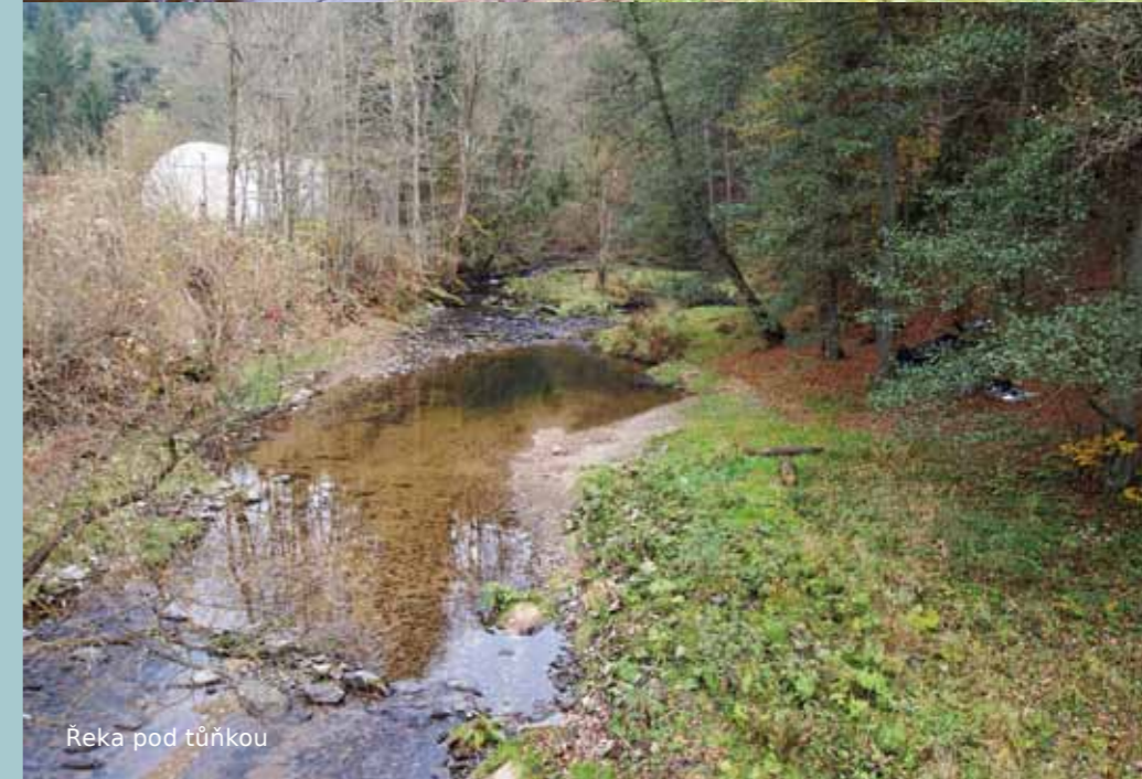
Řeka pod tůňkou