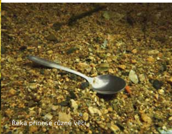
Řeka přinese různé věci

Nejbližší barokomora: Při potápění zde ji určitě nebudete potřebovat. ■