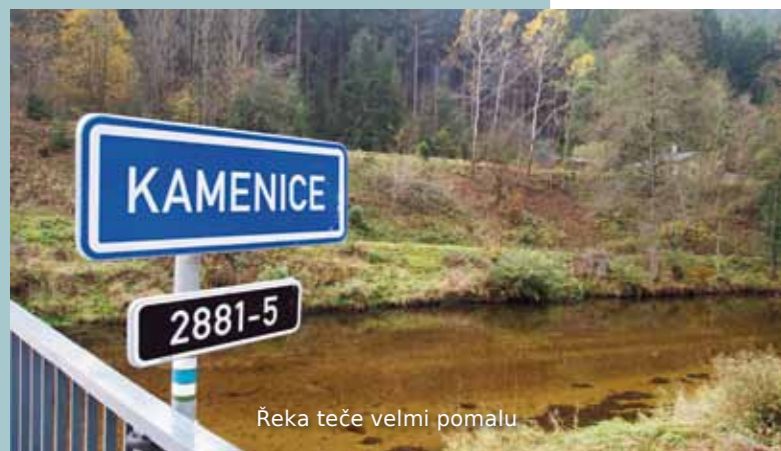
Řeka teče velmi pomalu

Řeka Kamenice pramení v Jizerských horách poblíž sedla Holubníku. Po několika kilometrech na řece stojí vodní nádrž Josefův Důl, která slouží jako zásobárna pitné vody pro Liberec. Po zhruba 36 kilometrech se Kamenice v Podspálově u Železného Brodu vlévá do Jizery. Kamenice se vyznačuje velmi čistou vodou a kromě potápěčů tu často narazíte také na vodáky a rybáře.