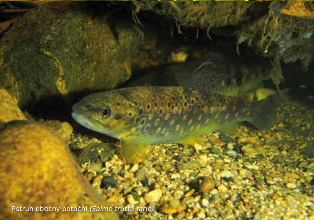
Pstruh obecný potoční ( Salmo trutta fario )

a budou pózovat před vašimi fotoaparáty. Pod kamennými převisy pak nejdete pstruhy, pokud se budete pohybovat pomalu, dostanete se k nim prakticky na dotek.