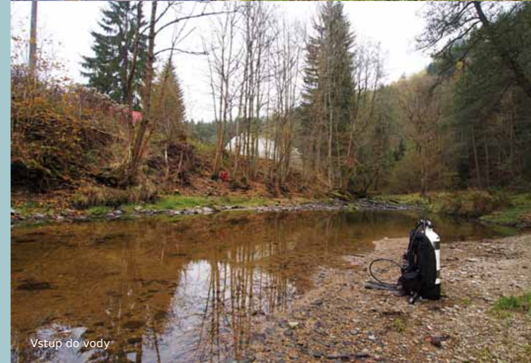
Vstup do vody