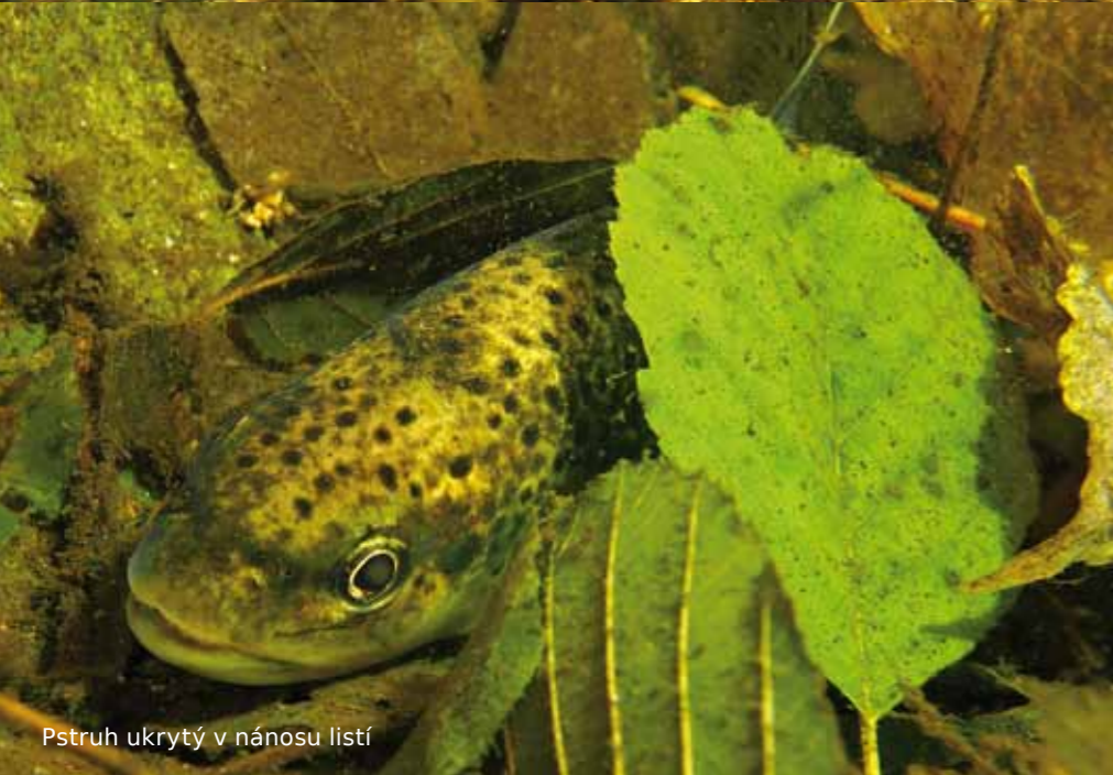
Pstruh ukrytý v nánosů listů