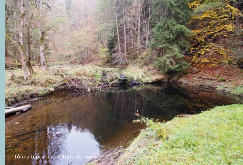
Tůňka u prvního vstupu do vody

Popis lokality: Nečekejte zde žádné hluboké potápění, největší hloubka je v tůňce, kde v nejhlubším místě dosahuje bezmála 3 metry, v samotné řece se hloubka pohybuje mezi 1 a 2 metry. Takže dost často vám budou lahve koukat nad hladinu. Proč se zde tedy vůbec potápět? Jednoznačně kvůli rybám, hlavně fotografové si zde určitě přijdou na své. Řeka je plná lipanů, ti jsou nejdříve trochu plašší, ale pokud si v klidu lehnete na dno a chvíli počkáte, zvědaví lipani připlují až k vám