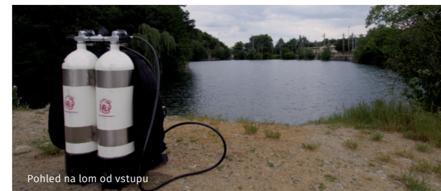
Pohled na lom od vstupu

Jediný možný příjezd je po železničních kolejích (vlečka), je potřeba se zastavit na nádraží v Blansku a u výpravního (vstup do kanceláře je vlevo z nástupi-