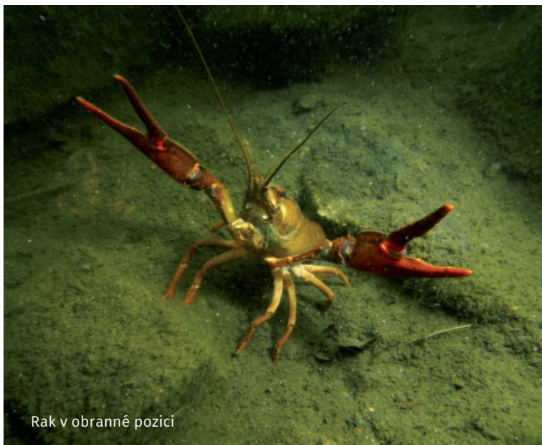
Rak v obranné pozici