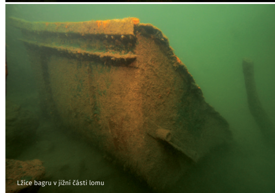
Lžice bagru v jižní části lomu