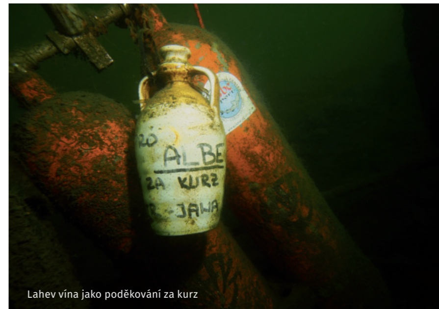
Lahev vína jako poděkování za kurz