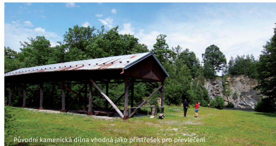
Původní kamenická dílna vhodná jako přístřešek pro převlečení

V obci Žulová přejedeme u nádraží přes železniční přejezd (směr na Černou Vodu), za ním přes most přes potok a hned za mostkem odbočíme doprava, pokračujeme po cestě kolem potoka cca 350 metrů, až vlevo uvidíme odbočku, u které je vývěsní tabule, dáme se po cestě vlevo a po zhruba 100 metrech je cesta uzavřena balva-