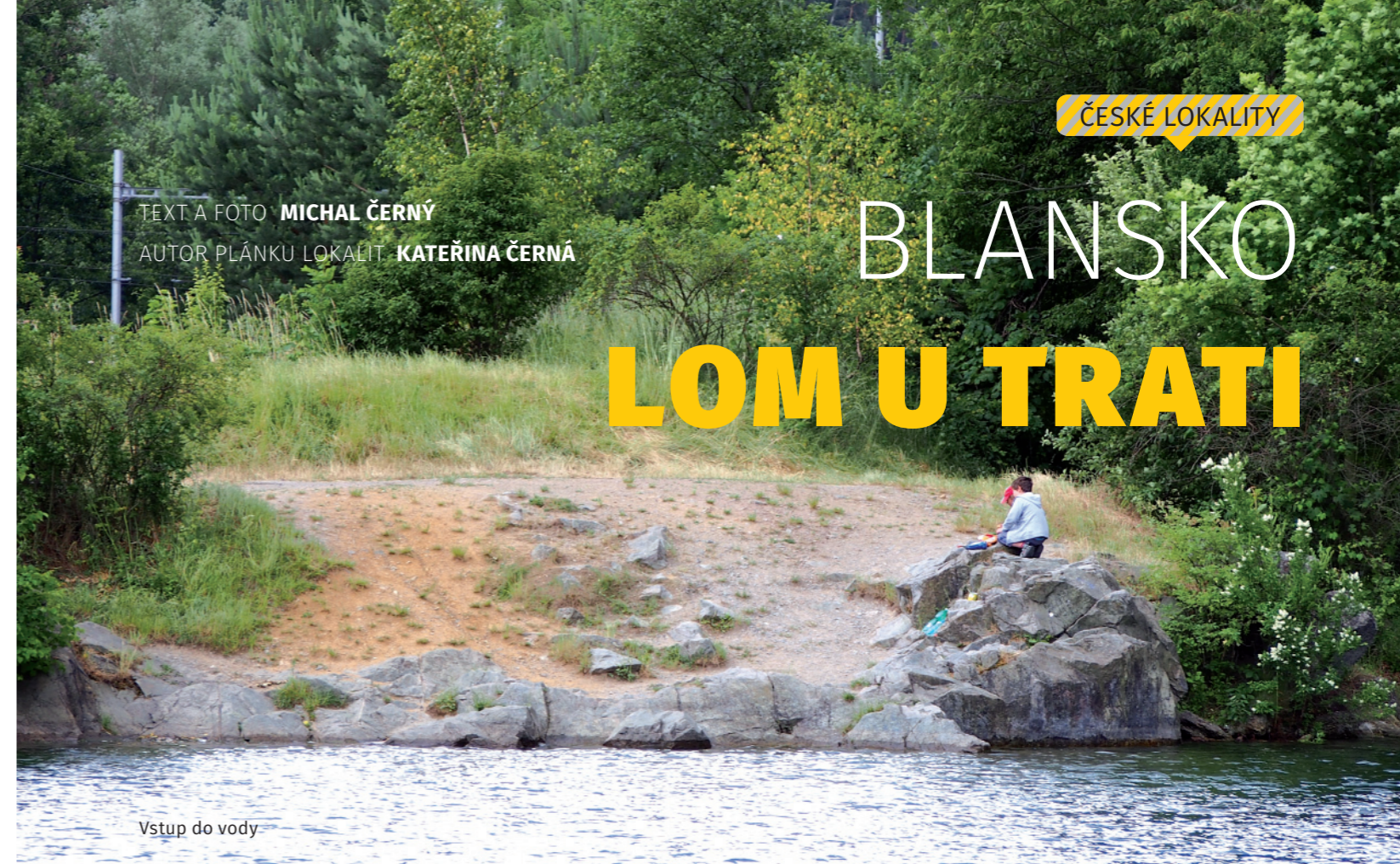
Vstup do vody