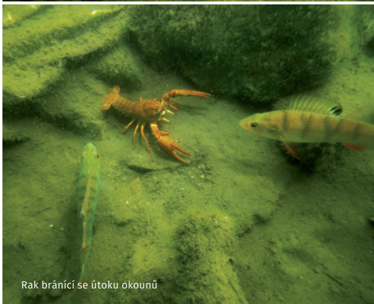
Rak brání se útoku okounů