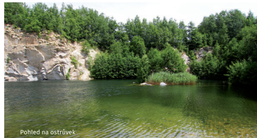
Pohled na ostrůvek

Vojenský záchranný útvar VZÚ 9519, Libušina ul., Olomouc