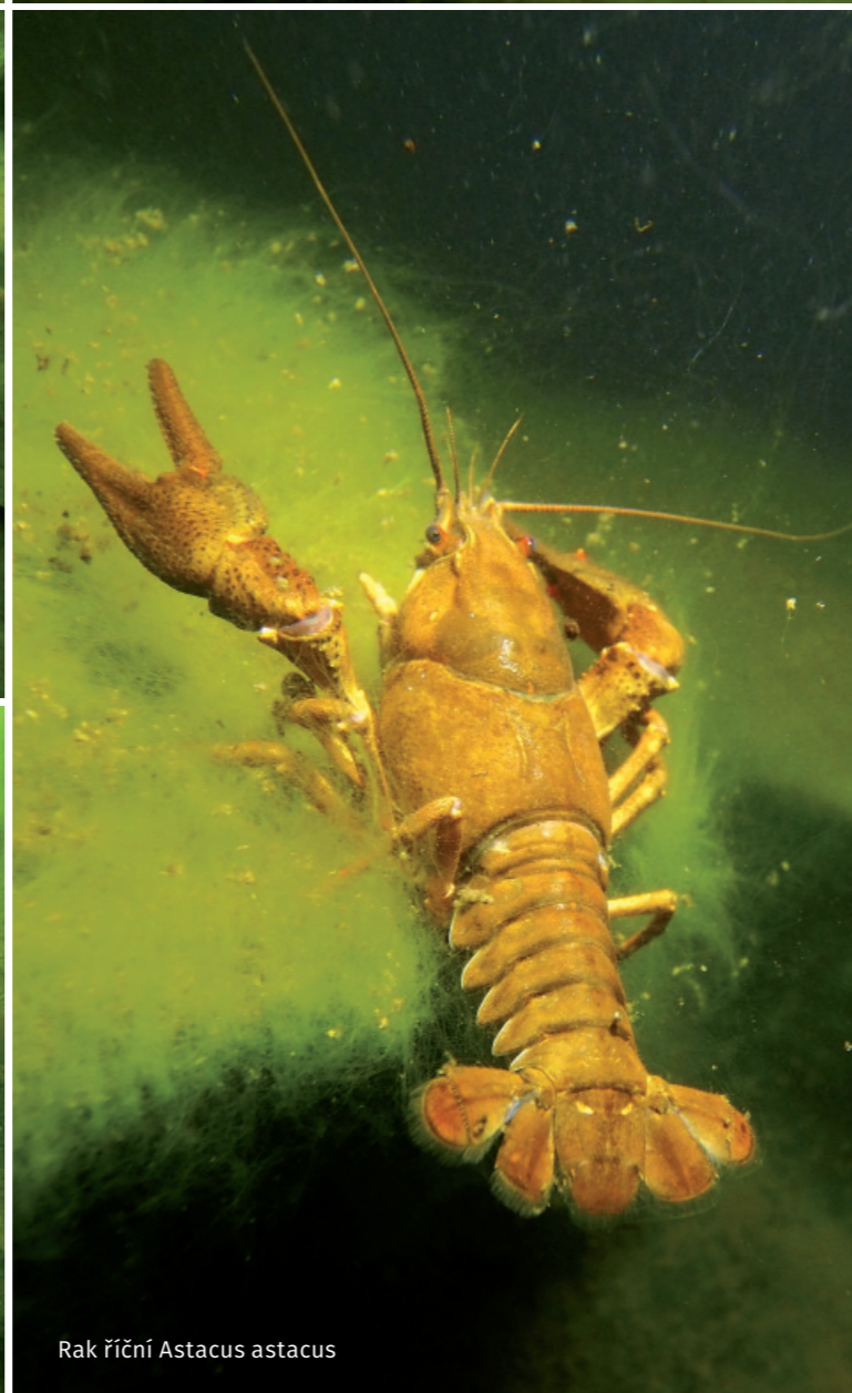
Rak říční Astacus astacus