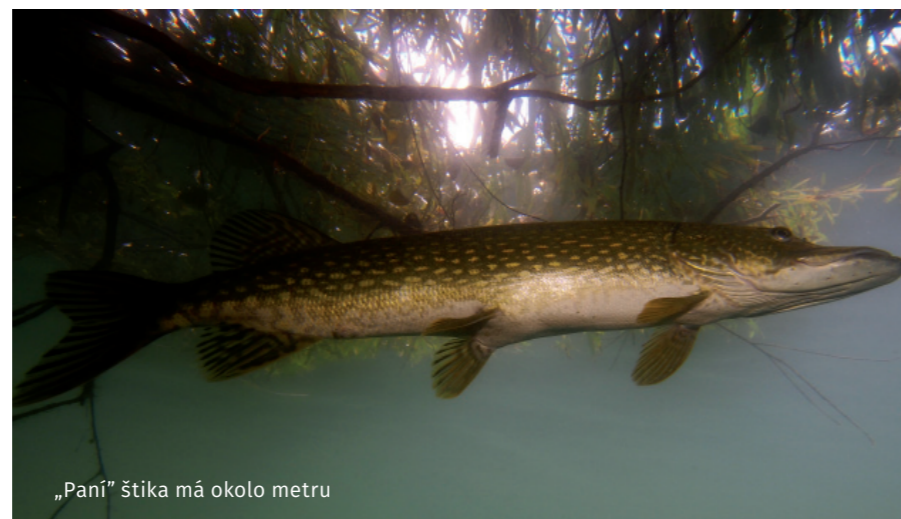
„Paní“ štika má okolo metru

Policie ČR, správa Jihomoravského kraje, Kounicova 24, Brno