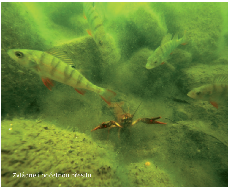
Zvládne i početnou přesilu