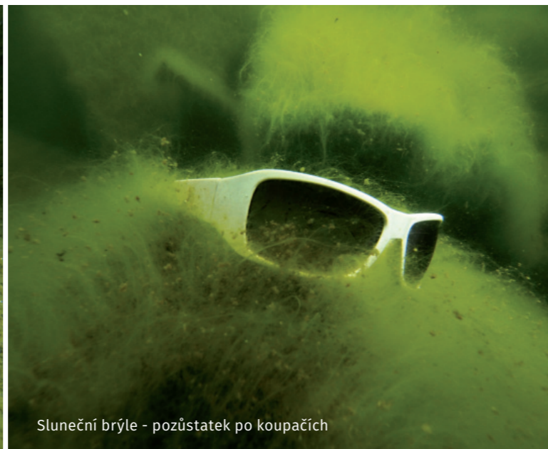
Sluneční brýle - pozůstatek po koupačích