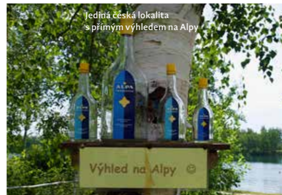
Jediná česká lokalita s přímým výhledem na Alpy

NEJBLIŽŠÍ BAROKOMORA: Pardubická nemocnice, Centrum hyperbarické medicíny, Kyjevská 44, Pardubice.