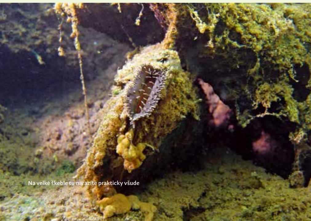
Na velké škeble tu narazíte prakticky všude

KRAJ: Vysočina NEJBLIŽŠÍ MĚSTO: Čenkov, Třešť GPS: 49°16'44.35"S 15°26'13.61"V TYP: lom MAXIMÁLNÍ HLOUBKA: 10 m PRŮMĚRNÁ VIDITELNOST DLE SP: 1 m NEJLEPŠÍ OBDOBÍ NA NÁVŠTĚVU: jaro, začátek léta, podzím PROVOZOVATEL: není PROVOZNÍ DOBA ZÁKLADNÍ: není CENÍK: vstup zdarma VSTUP: je pozvolný z malé písčité pláže, v jejíž bezprostřední blízkosti se dá zaparkovat NEJBLIŽŠÍ PLNÍRNA: Jaroslav Petřů, Svatojánská 433, Telč; tel.: 606 276 872 nebo David Tichý, Soustružnická 20, Dačice; tel.: 607 124 673 – u obou je plnění možné pouze po předchozí telefonické dohodě, cena 10 Kč/litr MOŽNOST PARKOVÁNÍ: zdarma přímo u lomu STRAVOVÁNÍ: na místě žádná občerstvení není, lze využít restaurace v Třešti PŘÍJEZD NA LOKALITU: Pokud pojedete od D1, tak sjeďte na Jihlavu, pokračujte pak na Třešť a z ní na Čenkov, lom se nachází asi 300 metrů za obcí směrem na Růženu po pravé straně silnice.