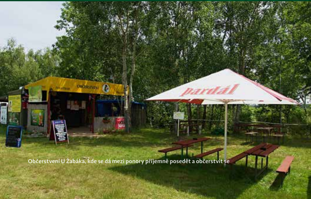
Občerstvení U Žabáka, kde se dá mezi ponory příjemně posedět a občerstvit se

řetězem, pro vjezd je nezbytná dohoda předem s provozovatelem občerstvení.