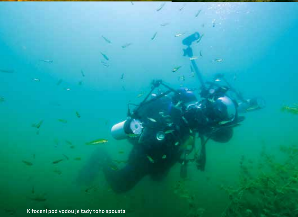
K focení pod vodou je tady toho spousta