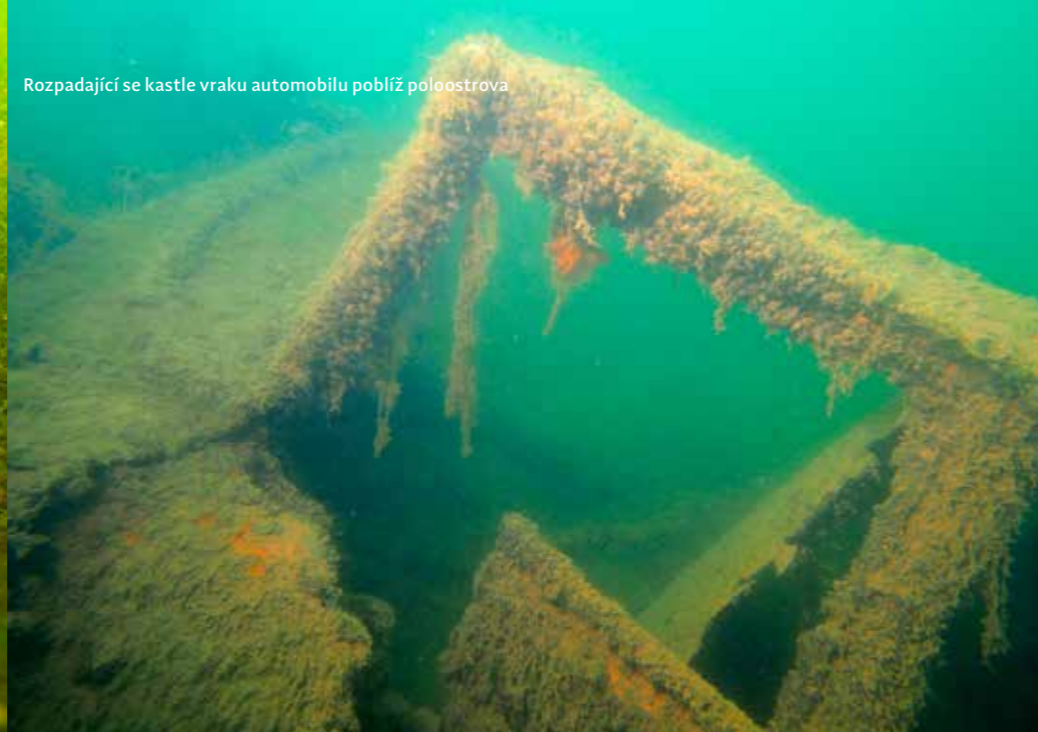
Rozpadající se kastle vraku automobilu poblíž poloostrova