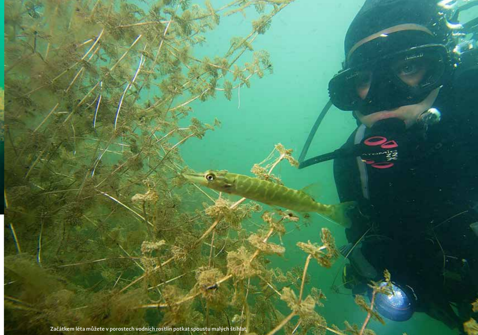
Začátkem léta můžete v porostech vodních rostlin potkat spoustu malých štíhlát

PODVODNÍ FAUNA: Okouni, slunečnice, bělice, kapři, amuři, cejni, líni, candáti, úhoři, sumci, štiky, slávičky.