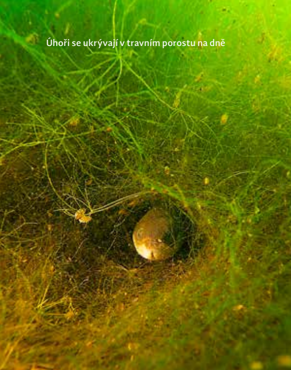
Úhoři se ukrývají v travním porostu na dně