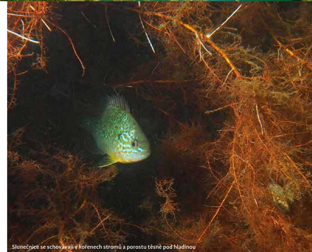
Slunečnice se schovávají v kořenech stromů a porostu těsně pod hladinou