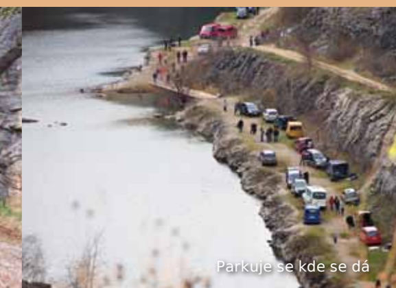
Parkuje se kde se dá