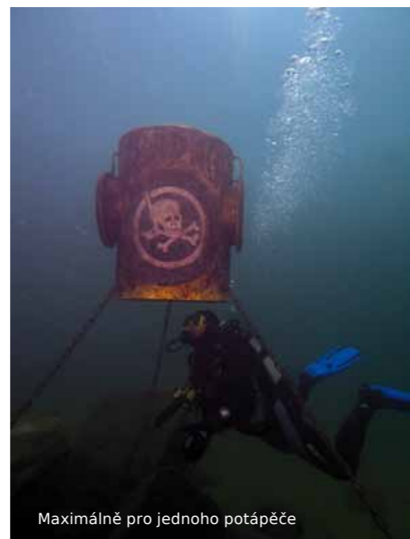
Maximálně pro jednoho potápěče

Popis lokality: Menší východní jáma má rozměry cca 150 x 60 metrů a maximální hloubku 11 metrů, větší západní jáma má rozměry cca 300 x 60 metrů a maximální hloubku 10 metrů, mezi nimi je hloubka cca 1 metr a dá se tedy mezi jámami proplavat. Více atrakcí najdete ve větší západní jámě.