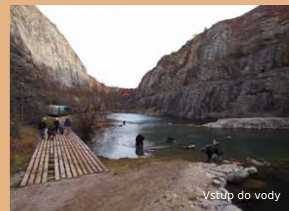
Vstup do vody

Nejlepší období na návštěvu: Pouze několikrát do roka, když je lom v rámci výcviku otevřen potápěčům.