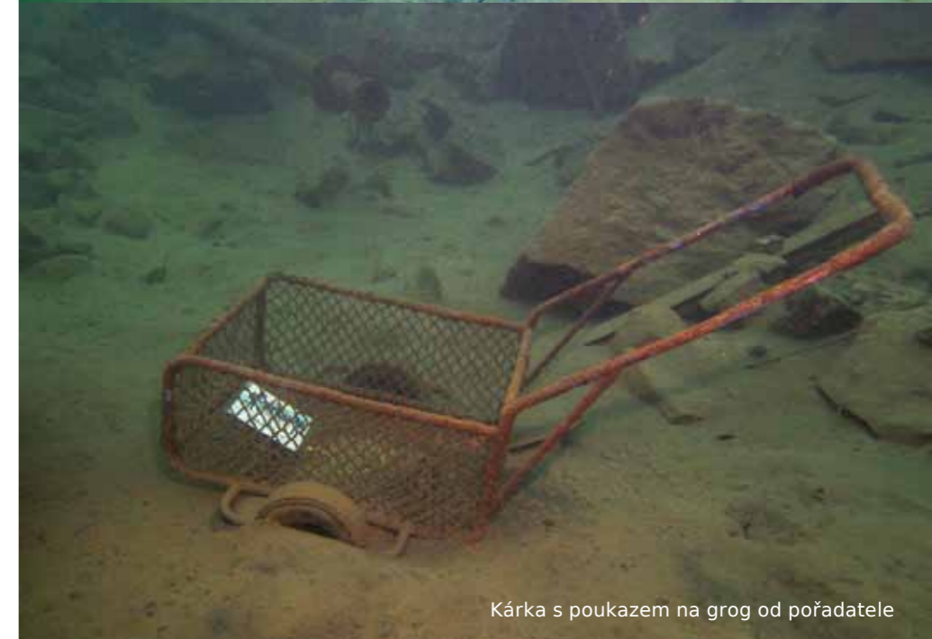
Kárka s poukazem na grog od pořadatele