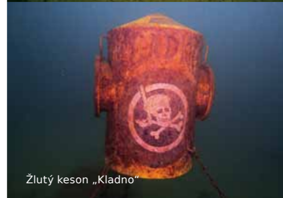
Žlutý keson „Kladno“

Popis lokality: Menší východní jáma má rozměry cca 150 x 60 metrů a maximální hloubku 11 metrů, větší západní jáma má rozměry cca 300 x 60 metrů a maximální hloubku 10 metrů, mezi nimi je hloubka cca 1 metr a dá se tedy mezi jámami proplavat. Více atrakcí najdete ve větší západní jámě.