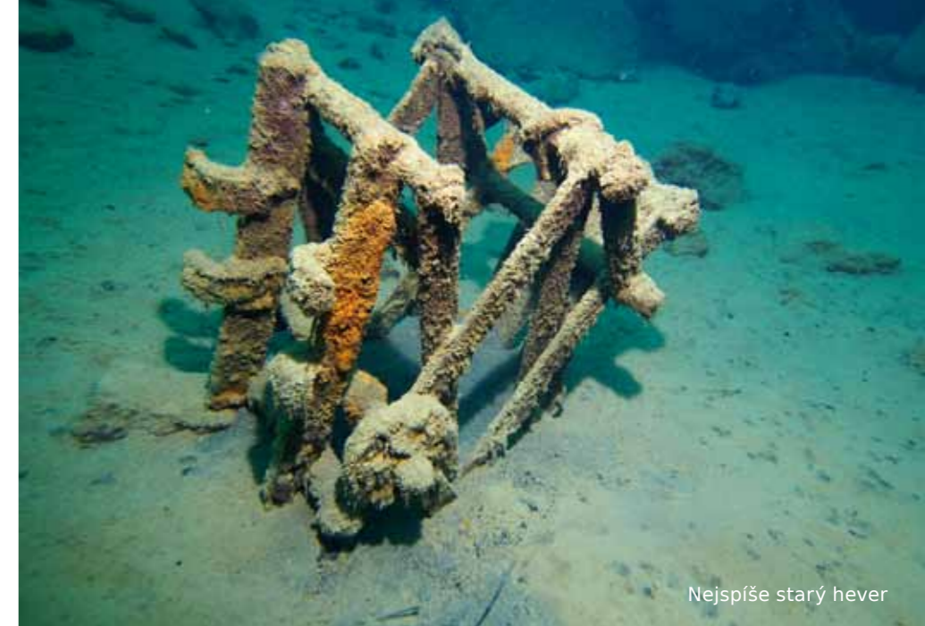
Nejspíše starý hever

Nejbližší barokomora: Všeobecná fakultní nemocnice, IV. Interní klinika, U nemocnice 2, Praha 2.