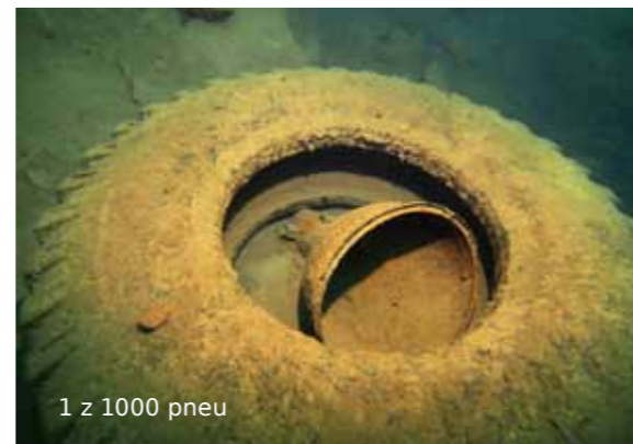
1 z 1000 pneu