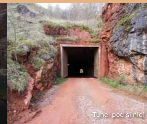
Tunel pod silnicí