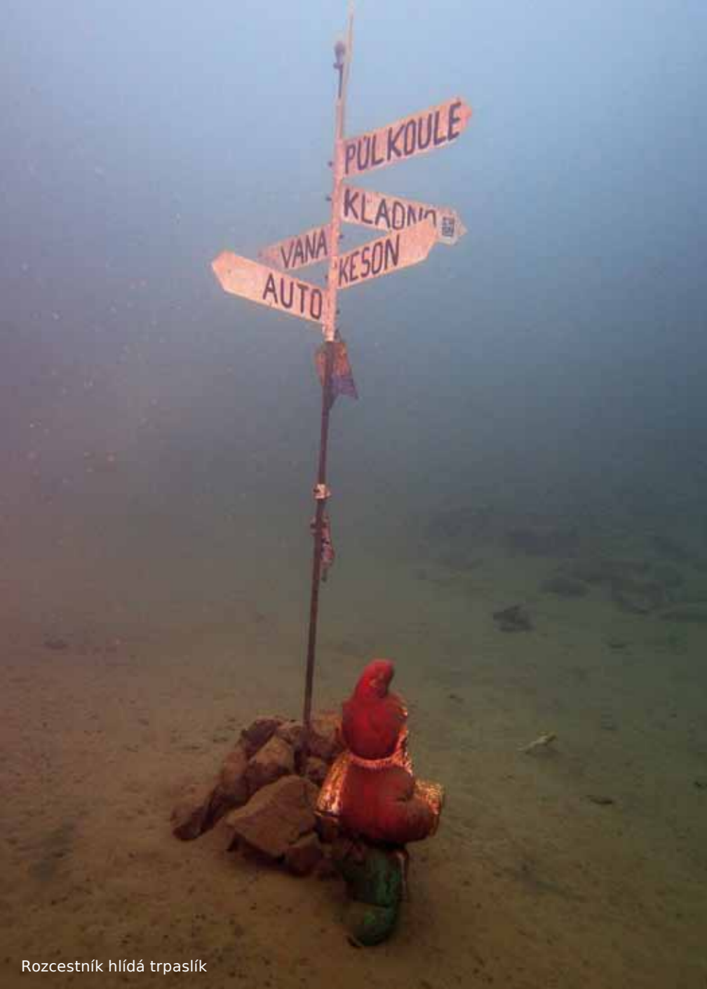
Rozcestník hlídá trpaslík