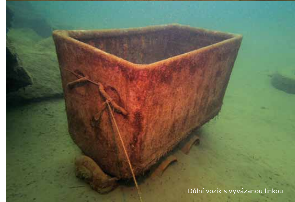
Důlní vozík s vyvážanou linkou